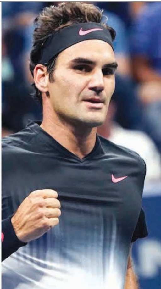
من سيحصد لقب البطولة الكبيرة؟