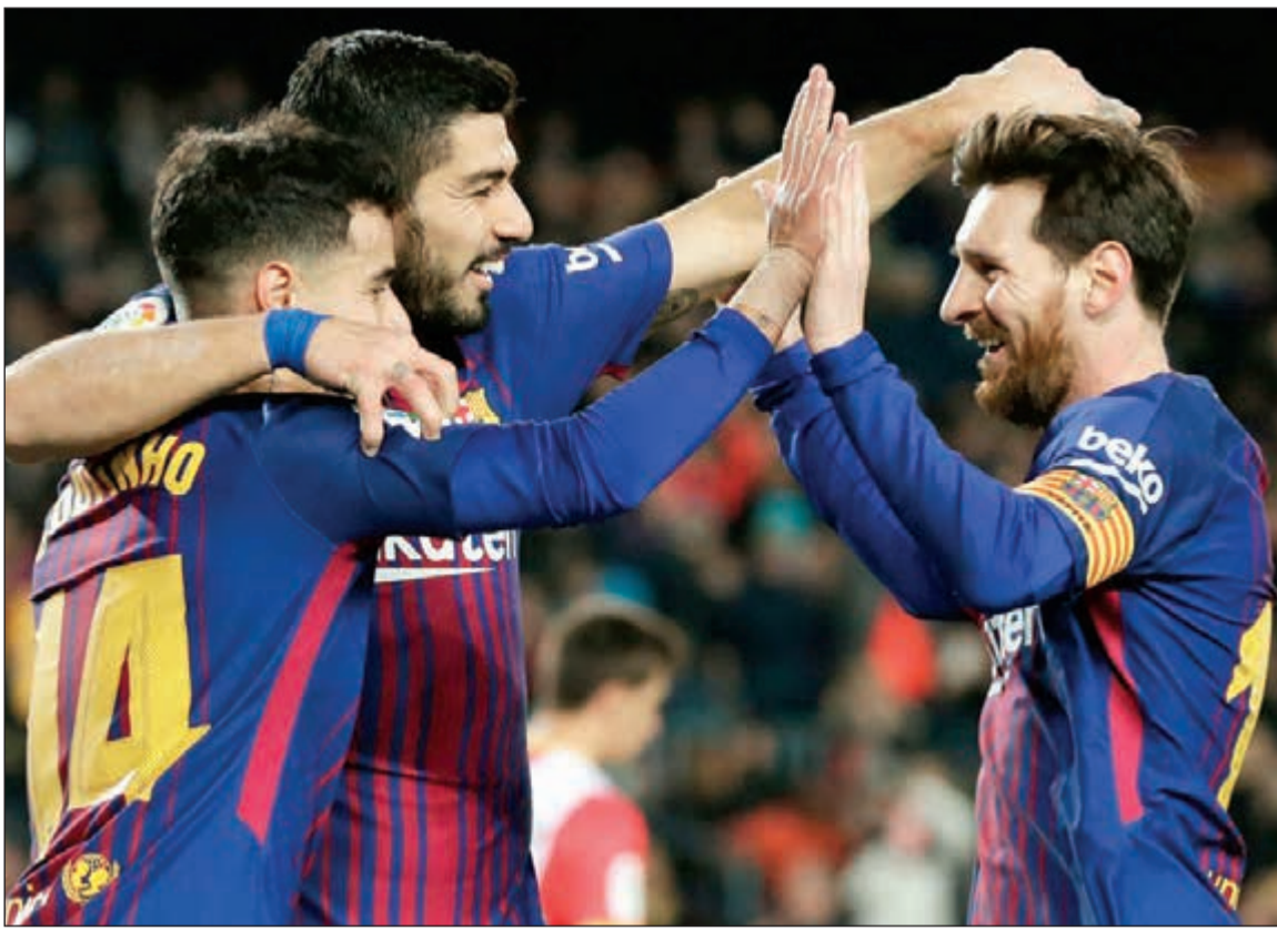
ثلاثي برشلونة الخفيف

اقرب فريق برشلونه كثيرا من تحقيق لقب الدوري الإسباني هذا الموسم، وذلك بعد تغلبه مؤخرا على ضيفه أتلتيك بلباو بهدفين دون رد، ضمن منافسات الجولة 29 من الليغا.