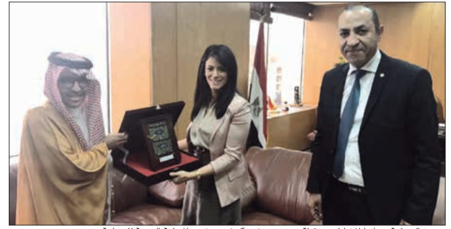
وزيرة السياحة د.رانيا المشاط مستقبلة د.بندر بن فهد آل فهد رئيس المنظمة العربية للسياحة ووليد الحناوي الأمين العام المساعد بالمنظمة

استقبلت وزيرة السياحة المصرية د.رانيا المشاط د.بندر بن فهد آل فهد رئيس المنظمة العربية للسياحة ووليد الحناوي الأمين العام المساعد بالمنظمة، لبحث أوجه التعاون المشترك. وتم خلال اللقاء تسليم الوزارة نسخة من تقرير الأنشطة والإنجازات للمنظمة لعام 2017. وقال آل فهد، إن المنظمة لديها خطط وبرامج تتطلع إلى تنفيذها في القريب العاجل بمصر من خلال التعاون القائم مع وزارة السياحة والتي تتمثل في إنشاء مكتب إقليمي للمنظمة العربية بمدينتي شرم الشيخ بهدف تنمية وتطوير السياحة العربية بالمنطقة أيضاً تنفيذ نهائيات البطولة العربية للرياضة الإلكترونية بمدينة الغردقة وإنشاء مركز إقليمي للتدريب والتأهيل بمدينة شرم الشيخ وتأسيس صندوق لدعم من الفقر والبطالة من خلال تنمية المجتمعات المحلية وايجاد سياحة مستدامة وتنفيذ مشروع القرية العربية والذي تم الانتهاء من دراسته ومخططاته، وإقامة الملحق العربي لضمان الاستثمار بمدينة شرم الشيخ والذي يساهم في جلب المزيد من الاستثمارات وإقامة الملحق الثاني للأمن السياحي العربي. وقعت بالتسسيق مع الجانب الإسباني اتفاقية توائم خلال فعاليات مؤتمر فيتور للسياحة بإسبانيا ما بين مدينة شرم الشيخ ومحافظته استمرت بإسبانيا وذلك بهدف تنمية وتطوير السياحة وتأتي هذه الاتفاقية من خلال رؤية واستراتيجية المنظمة لتنمية التعاون العربي الدولي مؤكداً تنطلع المنظمة لإقامة العديد من المنتديات وورش العمل والتي تخدم القطاع السياحي المصري مشيداً بالتطور السياحي الذي تحظى به مصر والتي تعتبر