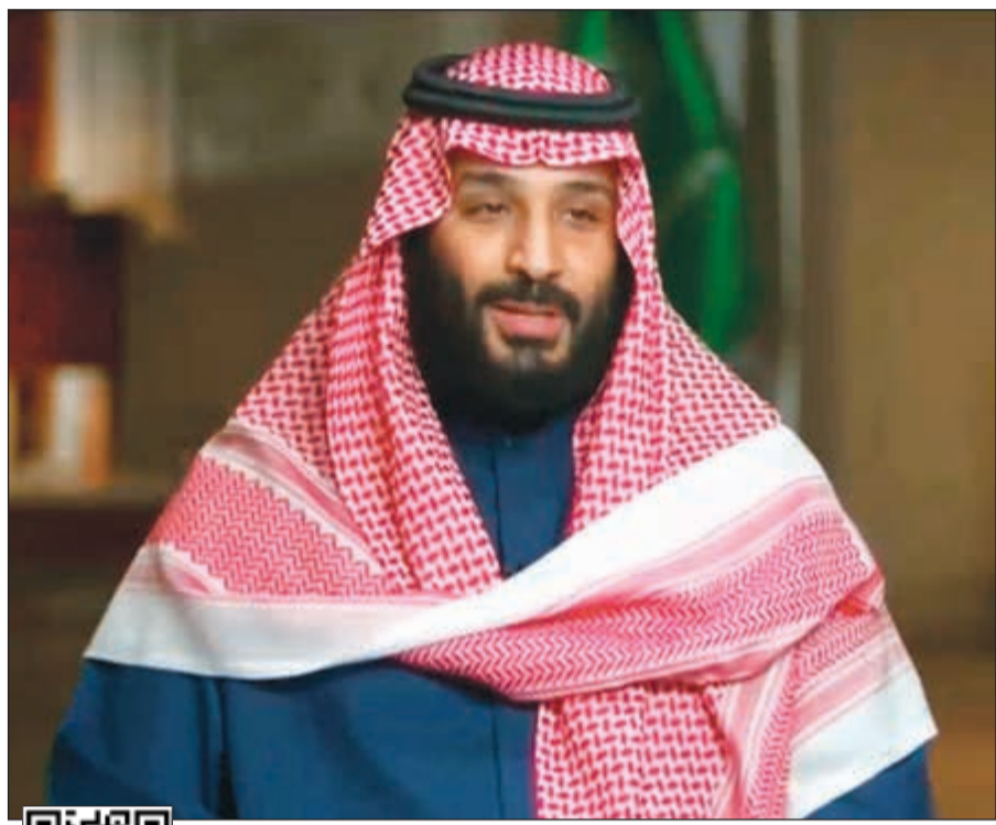
صاحب السمو الملكي الأمير محمد بن سلمان

العهد السعودي أنها ليست ندا للسعودية، سواء اقتصادي أو عسكري، مشيرا إلى أن طهران تؤدي عناصر تنظيم «القاعدة» وترفض تسليمهم، كما أن الفكر الإيراني تسدل إلى أجزاء كبيرة من اليمن. وقال انه يعتبر المرشد الأعلى للثورة في إيران، «هتلرا جديدا»، لأنه يتبع سياسة توسعية، وأوضح قائلا: «إنه يريد تنفيذ مشروعه في الشرق الأوسط بصورة تشبه تلك التي تصرف بها هتلر، الذي أيضا سعى للتوسع، وكثير من الدول في أوروبا والعالم كله لم تتفهم مدى خطورة هتلر حتى حصول ما حدث». وفي معرض رده على سؤال حول ما إذا كانت السعودية بحاجة إلى الأسلحة النووية من أجل التصدي لطهران، قال ولي العهد السعودي: «إن السعودية لا تريد امتلاك أي قنبلة نووية، لكن لا شك في أننا سننخذ إجراءات مناسبة حال تطوير إيران قنبلة نووية لها. من جهة أخرى، أكد الأمير محمد بن سلمان أن التوقيفات التي حصلت ضمن حملة مكافحة الفساد تمت بناء على القوانين والإجراءات المرعية، وشدد على أن ما تم من توقيفات كان ضروريا، قائلا: «ما قمنا به كان ضروريا ويتطابق مع القوانين، وقد حصلنا على أكثر من 100 مليار دولار من تسوية