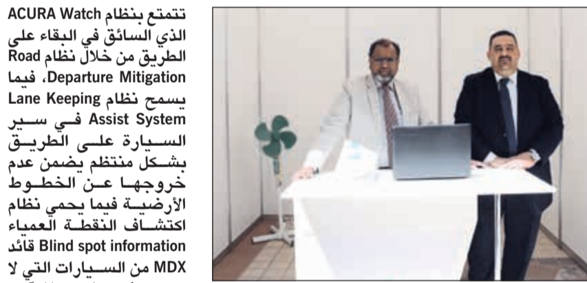
جناح ACURA في المعرض