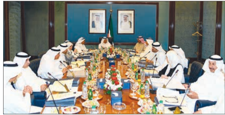
سمو الشيخ جابر المبارك مترشداً جلسة مجلس الوزراء

وبيأن على ما أثاره سمو رئيس مجلس الوزراء بشأن بعض المنشآت والمرافق الحكومية مثل المستشفيات والمطارات وغيرها من المرافق