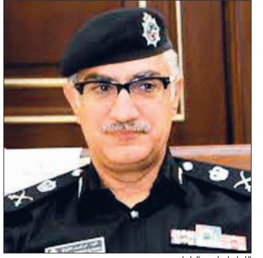
اللواء إبراهيم الطراح