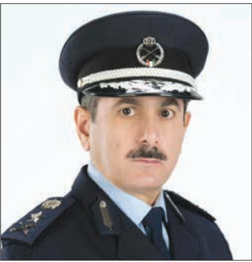
الفريق خالد المكارم

أعلن مدير عام الإدارة العامة للإطفاء الفريق خالد المكارم أن الإدارة العامة للإطفاء بصدد تنظيم ورشة عمل بعنوان «أطار سنديا للحد من مخاطر الكوارث وقاعة معلومات خسائر الكوارث على المستوى الوطني»، وذلك يومي 1 و2 أبريل المقبل، في مبنى الإدارة العامة للإطفاء الرئيسي، وذلك بالتعاون مع مكتب الأمم المتحدة للحد من مخاطر الكوارث، في إطار متابعتها لإجراءات تنفيذ أطار سنديا في الكويت. ويتكون «أطار سنديا» من أربع أولويات، أولاها فهم مخاطر الكوارث، وثانيها إدارة مخاطر الكوارث، وثالثها الاستثمار للحد من مخاطر الكوارث، والرابعة والآخرى التأهب للكوارث لتعزيز اجراءات الاستجابة لها، وجميعها تستهدف تقليل نسبة الوفيات الناتجة عن الكوارث العالمية وتقليل عدد الأشخاص المتضررين من الكوارث، وكذلك تقليل الخسائر الاقتصادية الناتجة عن الكوارث، وأضرار الكوارث على البنية التحتية، وزيادة استراتيجيات الحد من مخاطر الكوارث، وتعزيز الأنظمة والخدمات الخاصة بالإنذار المبكر.