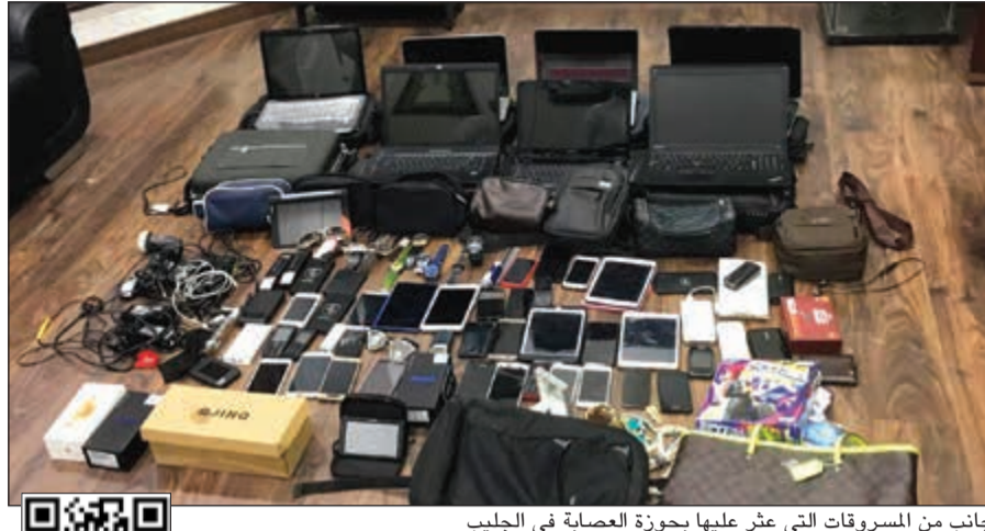
جانب من المسروقات التي عثر عليها بحوزة العصابة في الجليب