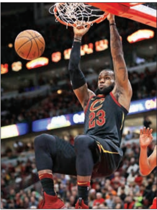
ليبرون جيمس.. تألق مستمر

حقق ليبرون جيمس نجم كليفلاند كافالييرز الـ «تريل دبل» رقم 70 في مسيرته عندما قاد فريقه إلى الفوز على مفضة شيكاغو بولز 114-109 في دوري كرة السلة الأميركي للمحترفين. وعزّن كليفلاند، بطل 2016 ووصيف 2015 و2017، فرصته في حجز بطاقته إلى الأدوار الإقصائية (بلاي أوف) بعد أن رفع رصيده إلى 40 فوزا في 69 مباراة في المركز الثالث للمنطقة الشرقية، خلف تورونتو رابتورز وبوسطن سلتيكس اللذين حسما تأهلها. وسجل «الملك» جيمس (33 عاما) الذي انهكته الإصابات 33 نقطة، أضاف إليها 13 متابعة و12 تمريرة حاسمة، ليصل إلى الـ «تريل دبل»، أي تحقيق أكثر من 10 على الأقل في ثلاث من الفئات الإحصائية الفردية الخمس (نقاط، متابعات، تمريرات حاسمة، سرقة الكرة أو صدأ)، رقم سبعين في مسيرته.