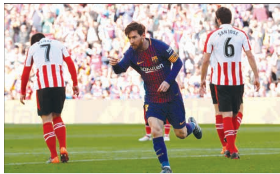
ميسي يواصل هوابته بالتهدف

الأهداف (39)، وأضاف البلجيكي نابنغولان الثاني (75). وفاز ميلان على ضيفه كييفو فيرونا 3-2.