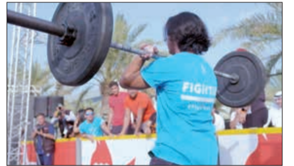
أحد الرياضيين خلال مشاركته في مسابقات المهرجان

الرشيد: «الوطني» يسعى للمساهمة في رفع الوعي الرياضي وخلق تواصل اجتماعي بين الشباب