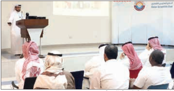
جانب من رحلة طلبة «التربية» للدوحة