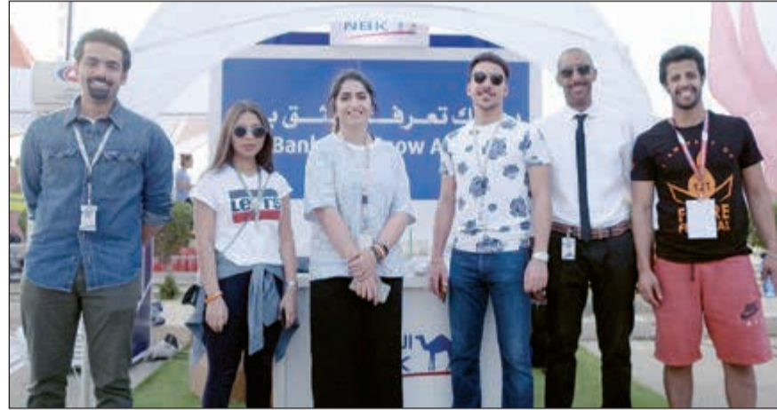
فريق «الوطني» أمام جناح البنك في المهرجان

قدم بنك الكويت الوطني رعايته لمهرجان فلير الرياضي للعام الثاني على التوالي، وهو الحدث الذي نظمه نادي «فلير فتنس» واستضافته جامعة الخليج للعلوم والتكنولوجيا بمشاركة شبابية كبيرة. ويهدف المهرجان إلى نشر التوعية حول أهمية الرياضة وتشجيع الروح الرياضية والتنافسية بين الطالبات والطلاب. وتضمن المهرجان العديد من الفعاليات والأنشطة الرياضية والاجتماعية، تخللتها مسابقات مختلفة كما أتت للمشاريع الصغيرة الكويتية عرض منتجاتها ليكون المهرجان عائلياً ورياضياً في الوقت نفسه.