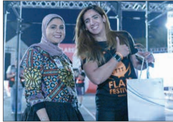
«الوطني» يكرم إحدى المشاركات

انطلاقاً من التزامها بدعم الشباب وتماشياً مع سياستها للمسؤولية الاجتماعية، رعت Ooredoo الكويت رحلة طلبة كلية التربية - جامعة الكويت للعاصمة القطرية الدوحة لمدة 5 أيام، وذلك الشهر الماضي بتعاون وتنظيم من القائمة المستقلة الطلابية. وتضمنت الرحلة زيارة عدد من أهم المؤسسات التعليمية والثقافية في قطر، مثل المدينة، جامعة قطر،