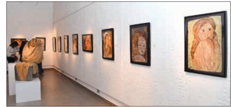
جانب من اللوحات المشاركة

وأوضحت خير أن معرض غايا - الأرض الأم يتيح للزوار ومحبى الفن فرصة للاستمتاع بأعمال فنية تم رسمها على لوحات متعددة الخامات مثل خامات القماش والخشب والزجاج والنسيج، حيث تقوم نظرية «غايا» على فكرة أساسية مفادها أن الفضاءات المحيطة بالأرض تندمج جميعها لتشكيل نظام معقد واحد يحافظ على استمرار الحياة في كوكبنا. وبعبارة أخرى، وبشكل غير مباشر، تقول