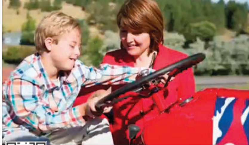
عضوة الكونغرس الأميركية كاثلين ماك موريس روجرز مع ابنتها المصابة بالتوحد كول

كثرت هذه الافتتاحية مهيبة.. وخلال اللقاء التلفزيوني قالت عضوة الكونغرس: بالفعل لقد شعرت بأن المقال مزعج للغاية. قيمة الحياة البشرية. وأن الزمن هو عنصر أساسي، وهو أمر لا بد لنا من الاعتزاز به. ويمكنني أن أقول إن.. روث (مؤلفة المقال) لم تقض وقتاً كافياً مع الأطفال المصابين بمتلازمة داون. وأود أن أدعوها لتأتي وتمضي بعض الوقت مع «كول». ابنتنا لديه عشر سنوات. وبالفعل، عندما علمنا بهذا الأمر (إصابته بمتلازمة داون). كان الأمر قاسياً علينا. فهو ليس ما نتوقعه ولا ما نتحم به. لكن ليس معنى كون الأمر قاسياً أنه ليس بالضرورة إيجابياً. فقد كان لوجود «كول» تأثير إيجابي هائل على شخصي وعلى عائلتي وعلى كل شخص يقابله. فهو مبهج. ولديه إمكانيات مستقبلية هائلة. وينبغي أن نحتمي بالإمكانيات المستقبلية التي يتمتع بها أي شخص في هذا البلد. ينبغي أن نصبح محاربين من أجل الكرامة البشرية والقيم البشرية. وذلك هو شغفي وتلك هي رسالتي إلى روث.