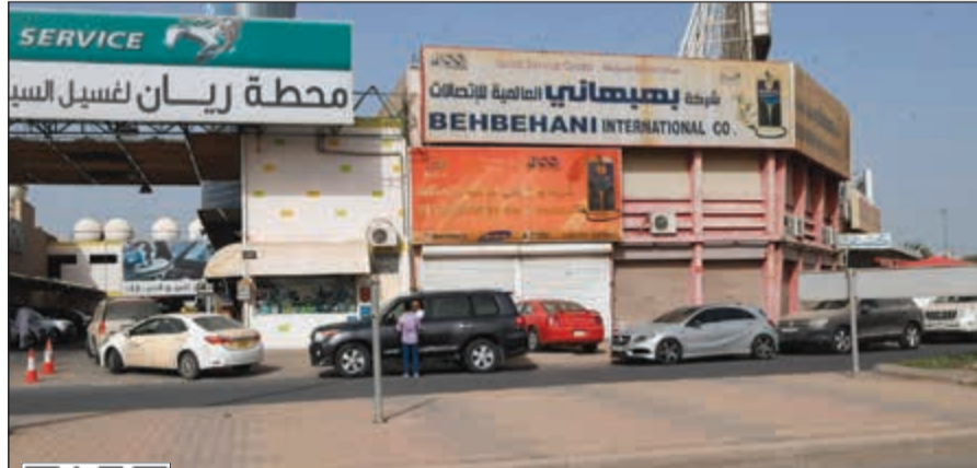
زحام أمام محطات غسيل السيارات أمس