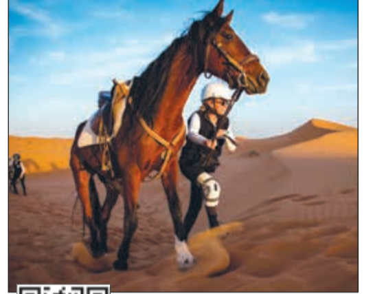
مغامرة في الصحراء