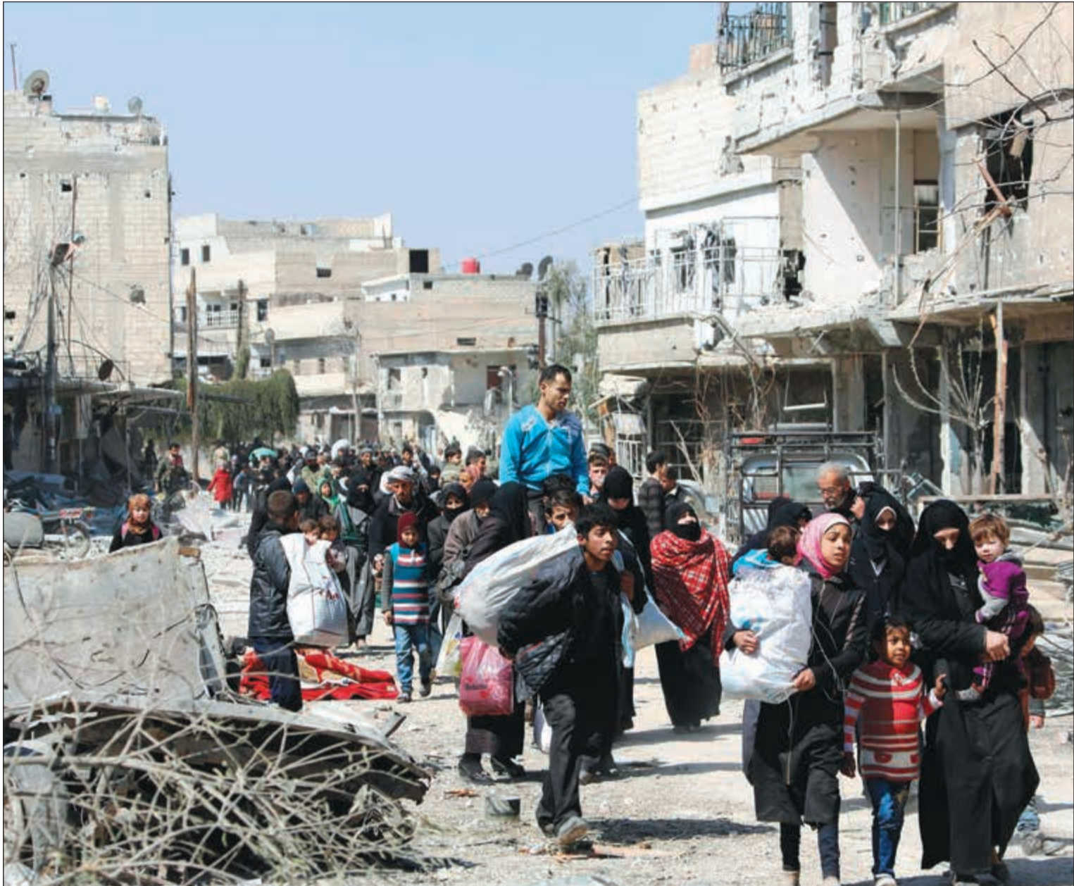
آلاف المدنيين يتزحون من بلدة جسرين في الغوطة الشرقية المحاصرة

واتهم النظام باستخدام «الأسلحة الكيميائية والقنابل الحمرية دوليا ضد المدنيين وان