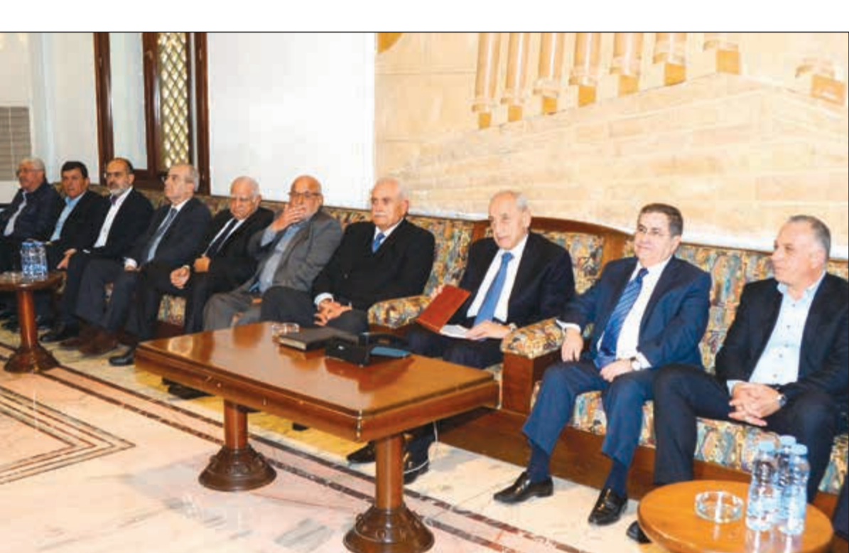
رئيس مجلس النواب نبيه بري خلال لقائه وفداً من بلديات شرق صيدا في المصيح