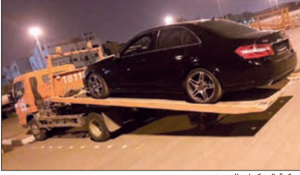
مركبة إلى كراج الحجز