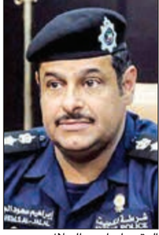
العقيد إبراهيم الجلال

قال رئيس لجنة أسبوع المرور الخليجي العقيد إبراهيم الجلال إن تقليل نسبة الحوادث والوفيات والإصابات المرورية يأتي أولاً بقرار من قائد المركبة ويمدى التزامه بالقواعد المرورية.