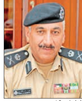
الواء فهد الشويح

تزامناً مع سوء الأحوال الجوية المصحوبة بأمطار رعدية وارتفاع مخسوب المياه على الطرق وتأثر الرؤية الأفقية.