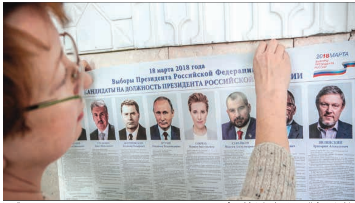
موظفة تعلق لافتة بالمرشحين لانتخابات الرئاسة الروسية اليوم

عواصم - وكالات: على وقع خلافاته المتهورة بشكل غير مسبوق مع الغرب، يتهاى الرئيس الروسي فلاديمير بوتين للعودة إلى الكرملين «قيصرا» منتخبا للمرة الرابعة في الانتخابات الرئاسية التي تجرى اليوم، لتمنحه ست سنوات يتوقع أن تكون «أخيرة»، خصوصا أنه تعهد بعدم التدخل لتعديل الدستور ليخضع له البقاء في السلطة لمدد أطول. ورغم وجود سبعة منافسين، تؤكد كل المؤشرات أن بوتين يحظى بحوالي 70٪ من نوايا التصويت لدى الناخبين، فيما تبدو فرص خصومه معدومة لاسيما مع منع معارضة الأشرس اليكسي نافالني من الترشح. غير أن فرحة بوتين بالنصر المتوقع لن تكون كاملة، حيث تمر علاقته بدول الغرب بأسوأ حالاتها منذ الحرب الباردة. إذ أعلنت موسكو أمس طرد 23 دبلوماسيا