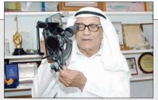
الخبير الفلكي د. صالح العجيري

وزير التربية برعى ويفتح ملتقى الكويت للتعليم - التعليم مسيرة حياة الذي تنظمه شركة NoufEXPO 15