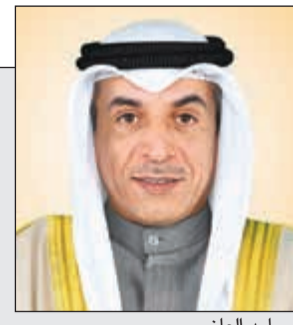
د. أحمد العازمي

وزير التربية برعى ويفتح ملتقى الكويت للتعليم - التعليم مسيرة حياة الذي تنظمه شركة NoufEXPO 15