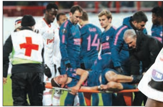
شكوك حول مشاركة فيليب لوييس في كأس العالم

أصيب ظهر إيسر نادي أتلتيكو مدريد ومنتخب الساق كما أعلن نادي أمس، ما يرسم علامة استفهام كبيرة حول مشاركته في مونديال روسيا 2018.