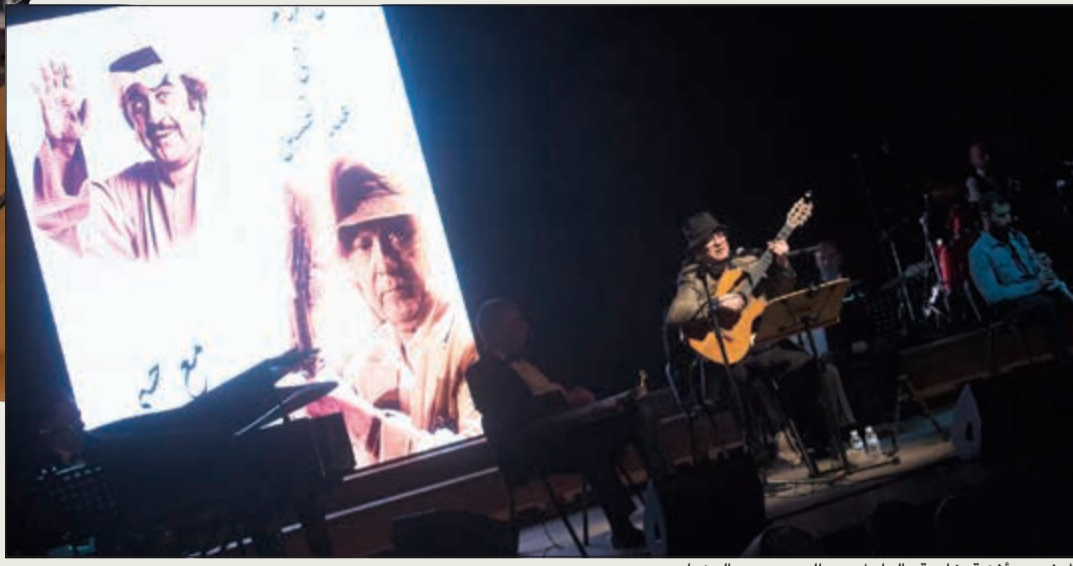
المدفعي وأغنية خاصة بالراحل عبدالحسين عبدالرضا

قبل الكبير. وانتقل من مدينته بغداد إلى محطته الأولى الكويت، ومنها إلى العالم، ليكون سفيرا للأغنية العربية التي حملها معه إلى أهم مسارح العالم، ومنها «الرويال ألبرت هول» في إنجلترا، ودار الأوبرا في برلين، ودار الأوبرا المصرية، ومهرجان «غلاستونبري» العالمي، ومسرح «روني سكوت» العالمي للجاز، وأعظم المهرجانات الكبيرة في العالم العربي.