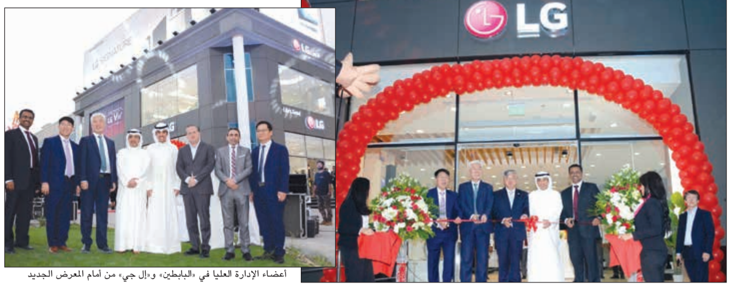
أعضاء الإدارة العليا في «البابطين» و«إل جي» من أمام المعرض الجديد

والفقاعات وغيرها، وقد تم إنشاء مطعم مذهل تحت الماء ومنطقة شاطيء رائعة. وتتوافر بالمنتج منطقة تسوق ضخمة بمجموعة من الماركات العالمية وساحة متاجر ومطاعم وحديقة للملاهي للأطفال ليستمتعوا بالأنشطة الترفيهية العديدة ويعتبر منتج «لاند أوف ليجيندز» مرتعاً للأساطير والغابات المسحورة والمغامرات. ويمزج منتج «لاند أوف ليجيندز» بين جميع المتطلبات لأفضل العطلات لتوفير تجربة لا مثيل لها مليئة بالفخامة والترفيه والراحة ولتقديم مشهد فني لا ينسى يجمع بين الماء والضوء والألوان والأحاسيس. وتتعدى خبرة المصمم فرانكو دراغون في الإبداع الفني فوق الـ 20 عاماً، حيث قام بتصميم عروض مسرحية في مدن أنحاء العالم، مثل (لاس فيغاس وباريس ووهان وروسيا وماكاو) التي شوهدت من قبل أكثر من 100 مليون مشاهد.