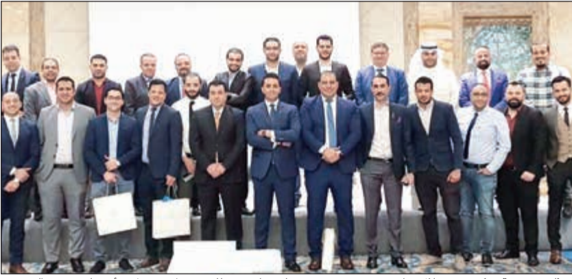
ممثلو مجموعة ريكسوس خلال تواجدهم في فندق «جي دبليو ماريوت» للترويج لمنتج «لاند أوف ليجيندز» الترفيهي

نظمت مجموعة فنادق ريكسوس عرضاً ترويجياً للمنتج الترفيهي «لاند أوف ليجيندز»، الأضخم من نوعه في تركيا، وذلك في فندق جي دبليو ماريوت، حيث تهدف المجموعة العالمية لتعريف العائلات الكويتية بالمنتج الترفيهي الذي يوفر مفهوماً جديداً لمنح الزوار من الخليج وجميع أنحاء العالم فرصة اكتشاف تجربة لا تنسى. وتضم المدينة الترفيهية تصاميم وشخصيات خيالية مصممة على يد فرانكو دراغون المعروف عالمياً في مجال الفن والترفيه. ويشمل منتج «لاند أوف ليجيندز» غرماً وأجنحة فاخرة ملائمة للعائلات مزودة بوسائل الراحة الحديثة وأجهزة الـ «بلاي ستيشن» للأطفال، وبالإضافة إلى ذلك توجد 5 مطاعم وناد صحي عالمي ومركز للياقة البدنية. ويتضمن المنتج الملاهي المائية «أكوا وورلد» التي تضم أكثر من 70 لعبة مائية وجولات سفاري تحت الماء ولقاءات مع الحيوانات البحرية كالدلافين