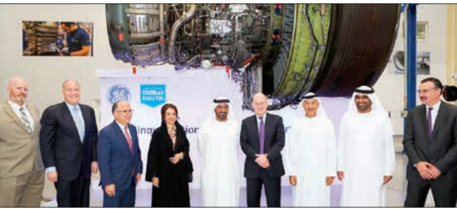
لقطة جماعية خلال حفل افتتاح المركز الجديد

افتتحت «جنرال إلكتريك للطيران» مركز صيانة وتصليح محركات الطائرات ضمن مشروع سلسلة توريد الطيران في منطقة الطيران بدبي الجنوب، في خطوة تمثل توسعة لنطاق خدمات صيانة المحركات التي تقدمها الشركة إلى أحد أهم مراكز قطاع الطيران في المنطقة. وتقوم «جنرال إلكتريك» بتشغيل مركزها لصيانة وتصليح محركات الطائرات مع شركة «طيران الإمارات» منذ عام 2013، وتقدم حلولاً وخدمات متكاملة لكافة محركات GE وCFM المستخدمة على طائرات «الإمارات»، ومع إطلاق المنشأة الجديدة في «دبي الجنوب»، سيقدّم المركز خدمات الصيانة والتصليح الفورية لجميع الناقلات الإماراتية بما في ذلك «طيران الإمارات» و«الانحاض» والعربية للطيران و«فلاي دبي»، ويمثل مركز «جنرال إلكتريك» لصيانة وتصليح المحركات إضافة هامة إلى المنظومة الشاملة لمشروع «دبي الجنوب» الذي تم تصميمه ليقدم خدماته إلى قطاع الطيران على المستوى العالمي، مع إمكانية إجراء عمليات الصيانة والتصليح لما يصل إلى 20 محركاً من طراز IB-LEAP و 1A-LEAP سنوياً، بما يشمل استبدال الوحدات الساخنة.