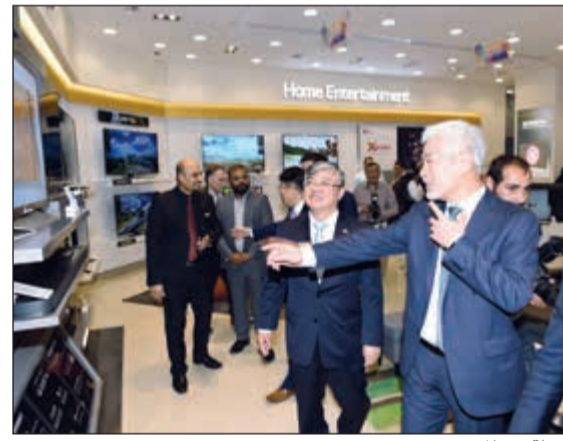
جولة في المعرض

افتتاح المعرض يؤكد الريادة المتقدمة للشركة في السوق ونمو الولاء لعلامة «إل جي» التجارية في المنطقة