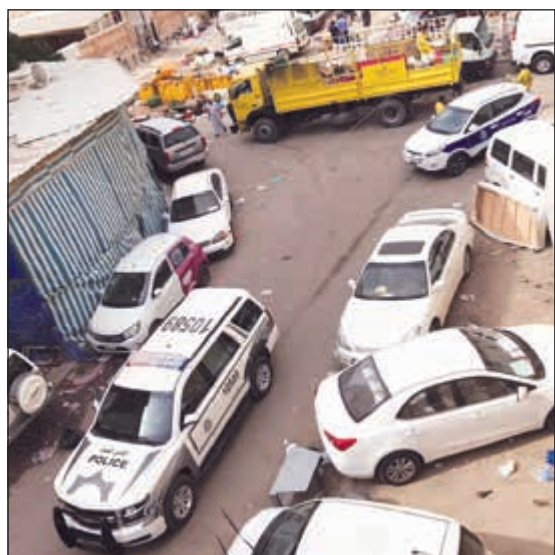
دوريات الأمن والبلدية خلال الحملة

الاسواق العشوائية لانوا بالفرار فور مشاهدتهم دوريات الامن تاركين البسطات، حيث تم ضبط الاسماك والخضراوات والفواكه التي كانوا يبيعونها على ابناء اقامها وافدون في الساحات لبيع الاطعمة التالفة غير الصالحة للاستهلاك الادمي. واضاف المصدر ان الوافدين القاطنين على