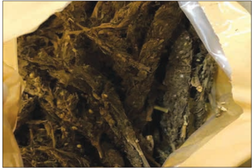
الماريغوانا المهربة في الأمتعة

ومراقب مطار الكويت الدولي عيسى بن عيسى ان مفتشا جمركيا اشتبه في وأفد آسيوي خلال تمرير أمتعته على الأجهزة الخاصة بتفتيش الحقائق، فقام بإخضاع حقيبته للتفتيش اليدوي، وتبين وجود 3 لفافات بين الملابس بها مادة الماريغوانا، وتمت إحالة المتهم والمضبوطات الى الجهات المختصة.