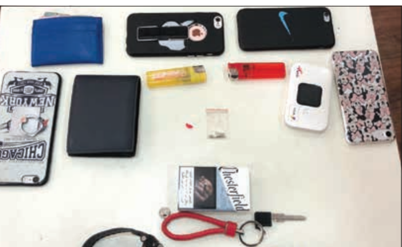
أدوات تعاط بعد التحفظ عليها

أمان في منطقة الفروانية وعند تجرله للتوقيع على المخالفة سقط منه كيس به مادة الشبو المخدر وتمت إحالته ومراقفته إلى جهة الاختصاص.