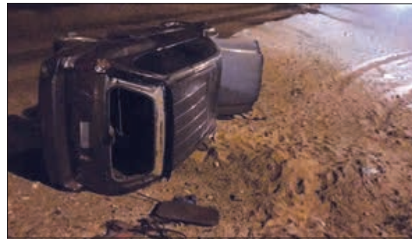
المركبة بعد انقلابها على طريق السالمي