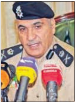
لواء خالد الدين

شهدت منطقة كبد حادثة دهس لطفلتين (6 سنوات) و(12 عاما) بمركبة يقودها مجهول وتم ادخالهما مستشفى الفروانية بعد تعرضهما لإصابات متفرقة وكسور حيث تم تسجيل قضية تحت مسمى دهس وإصابة وهروب قائد مركبة أميركية. وأمر وكيل قطاع الأمن الجنائي اللواء خالد الدين بسرعة ضبط الشخص وتحديد هويته. وقال مصدر أمني ان بلاغا ورد إلى غرفة عمليات الداخلية من قبل مواطن