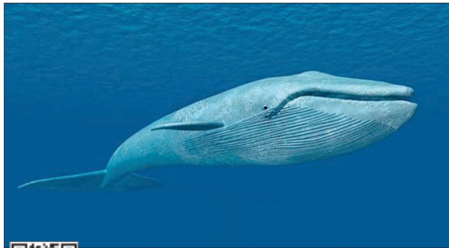
الحوت الأزرق يواجه خطر الانقراض بشدة

في المياه العذبة كالتماشيح وأفراس النهر والدلافين النهرية مهددة أيضا ولا تحظى بحماية مناسبة.