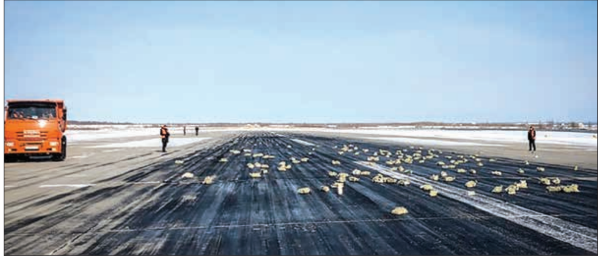
سبائك الذهب على مدرج مطار ياكوتسك

السلطات. وتظهر صور نشرتها السلطات عشرات سبائك الذهب، مبعثرة على المدرج المغطى بالثلج وعناصر من الشرطة يتفحصون الثغرة في الطائرة. وأوضح مكتب وزارة الداخلية في المنطقة في تصريح أورده وكالة «تاس» العامة للأخبار «عقرا حتى الآن على 172 سبيكة يبلغ وزنها الإجمالي حوالي 3.4 أطنان» فيما وزن الحمولة كاملة يصل