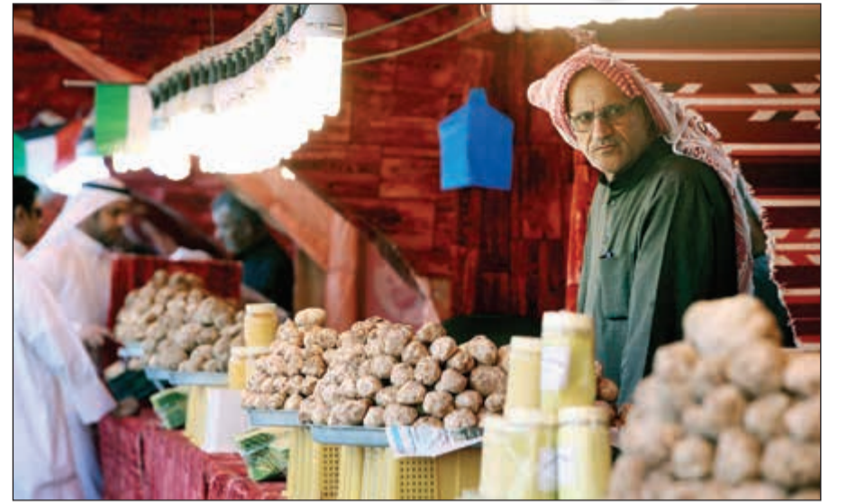
الفقع في السوق بانتظار الزبائن