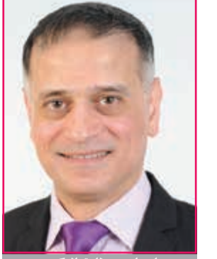
إعداد: د. طارق البكري