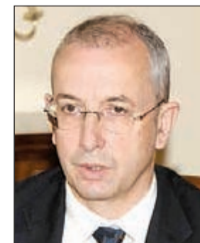
السفير البريطاني مايكل دافنبورت