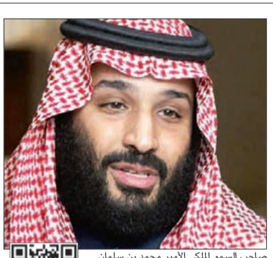
صاحب السمو الملكي الأمير محمد بن سلمان