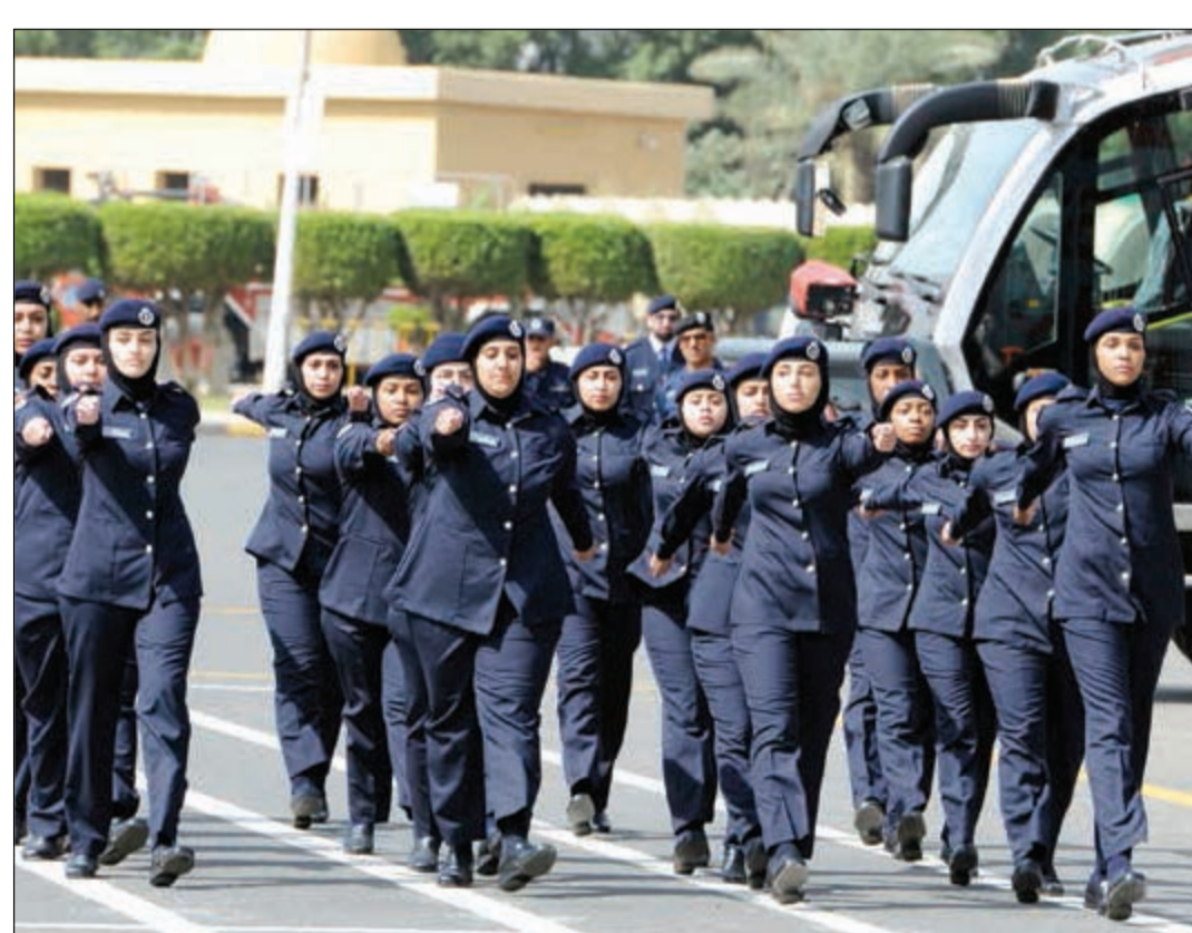
مفتحات في قطاع الوقاية خلال طابور عرض التخرج

علمت «الأنباء» من مصادر نفطية مسؤولة ان مؤسسة البترول الكويتية قررت تأجيل إغلاق مصانع الأسمدة الى شهر مايو 2018 بدلاً من نهاية الشهر الجاري وذلك لتفادي حرق الغاز. وفي تعميم حصلت «الأنباء» على نسخة منه، قال الرئيس التنفيذي لمؤسسة البترول الكويتية نزار العدساني ان شركة نفط الكويت تواجه حالياً صعوبات في القيام بتركيب وتشغيل ضواغط الغاز النحيل قبل نهاية مارس الجاري كما كان متوقفاً. وأوضح انه سيتم تأخير الإغلاق الى مايو المقبل لتفادي حرق الغاز في ضوء محدودية مستهلكي الغاز النحيل المنخفض الضغط مقابل الكميات المنتجة منه من مصانع إسالة الغاز في شركة البترول الوطنية الكويتية.