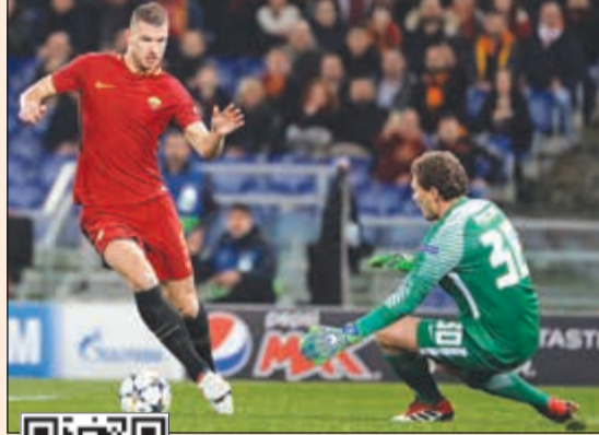
دزيكو يسجل هدف التأهل