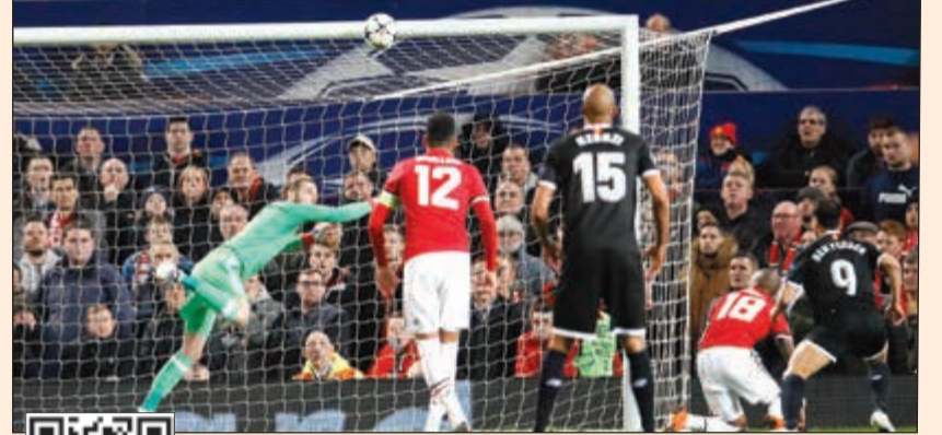
بن يدر يغتال أحلام الشياطين