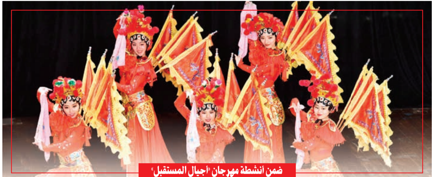
ضمن أنشطة مهرجان «أجيال المستقبل»