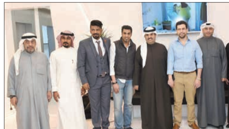
الشيخ دعيج الخليفة يتوسط نخبة من الحضور