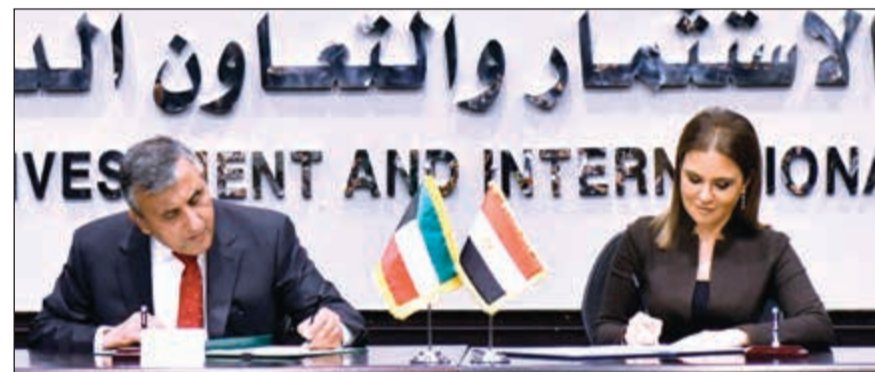
د.عبدالوهاب البدر ود. سحر نصر يوقعان إحدى الاتفاقيات

أهالي سيناء، حيث يستفيد من المشروع الأول حوالي 24,2 ألف نسمة بعدة مناطق أهمها مدينة بشر العبد، وقرية الحفجافة. بينما سيسهم المشروع الثاني في إقادة 7,6 آلاف نسمة تقريبا في عدة مناطق أهمها مدينة نخل وقرية النقب، بالإضافة إلى العدد الكبير من المواطنين والمسافرين الذين سيستفيدون من المشروع من غير سكان سيناء. وتتمثل الاتفاقية الثالثة في منحة بقيمة 500 ألف دينار كويتي لدعم المرحلة الثانية من نشاطات مركز الوثائق الاستراتيجية التابع لمركز المعلومات ودعم اتخاذ