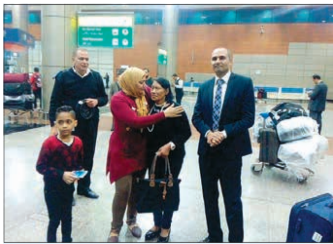
جانب من استقبال السيدة المصرية المسنة في القاهرة

بإتي التفاصيل على موقع «الأنباء» www.alanba.com.kw