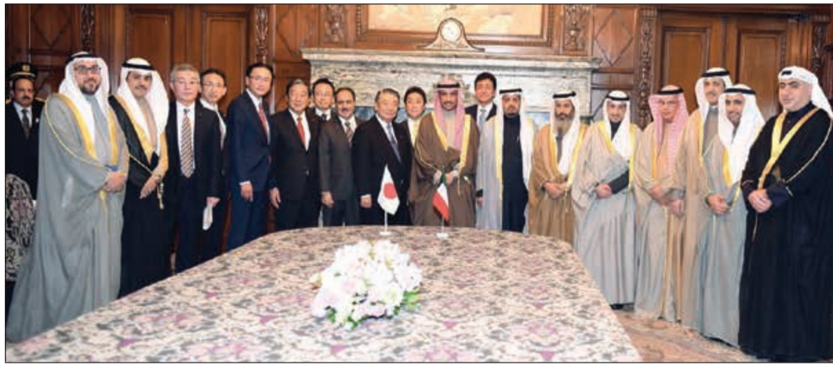
رئيس مجلس الأمة مرزوق الغانم والوفد البرلماني المرافق له مع رئيس مجلس النواب الياباني تاداموري أوشيميا