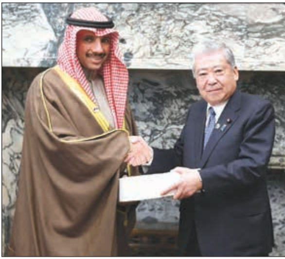
الغانم مع رئيس مجلس المستشارين تشويتشي دات