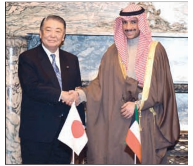
الرئيس مرزوق الغانم مصافحا رئيس مجلس النواب الياباني