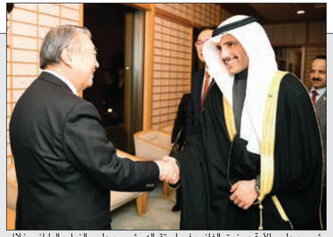
رئيس مجلس الأمة مرزوق الغانم وفي استقباله رئيس مجلس النواب الياباني خلال حفل عشاء أقامه في منزله على شرف الغانم والوفد المرافق له

ثول مرة في الكويت شاهد الصفحة بتقنية الواقع المعزز حمل تطبيق Zappar