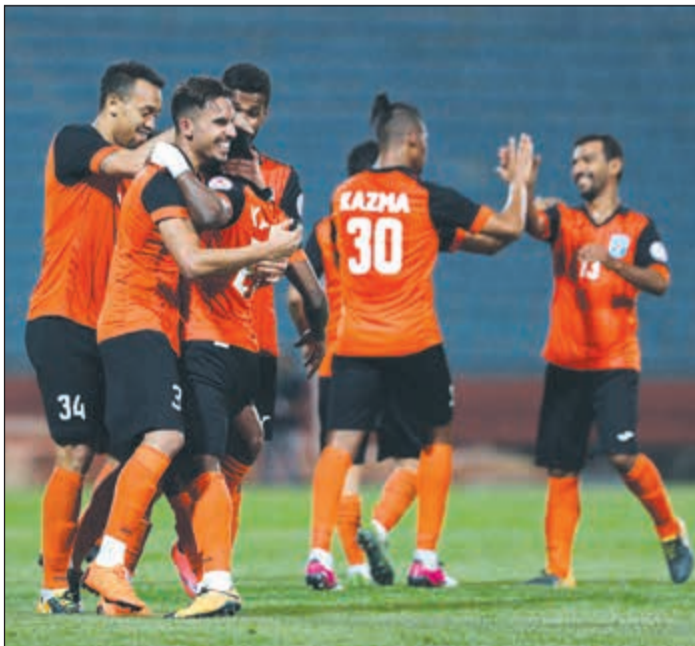
كاظمة يحتاج مزيدا من الانتصارات