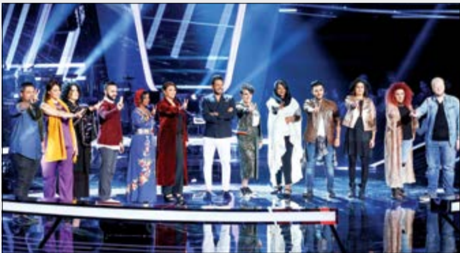
صورة لحماتي وفريقه