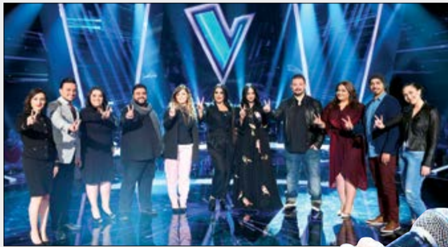
أحلام تتوسط فريقها