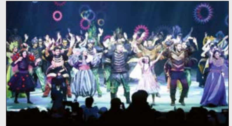
أشكناكي في مسرحية «زين عقلة الأصعب»

برايك تقلص أعداد المسلسلات هذا العام سيكون أثره