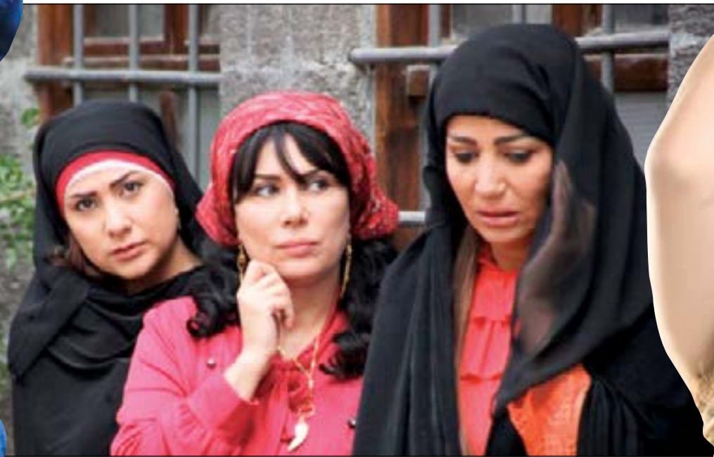
مشهد من مسلسل «طوق البنات»

تأجيل العمل وبالتالي عدم البدء بالتصوير حاليا، وكان من المقرر أن يشارك في بطولة الجزء الخامس مجموعة من النجوم وفي مقدمتهم معتمد النهار بالإضافة لعودة يامن الحجلي لأداء شخصية «أبو العباس» فضلا عن مشاركة نجوم الأجزاء السابقة بينما اعتذر النجم رشيد عساف عن الاستمرار بالعمل.