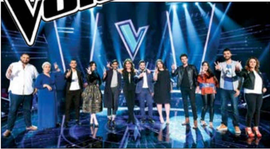
فريق إليسا المتأهل للمرحلة الثانية