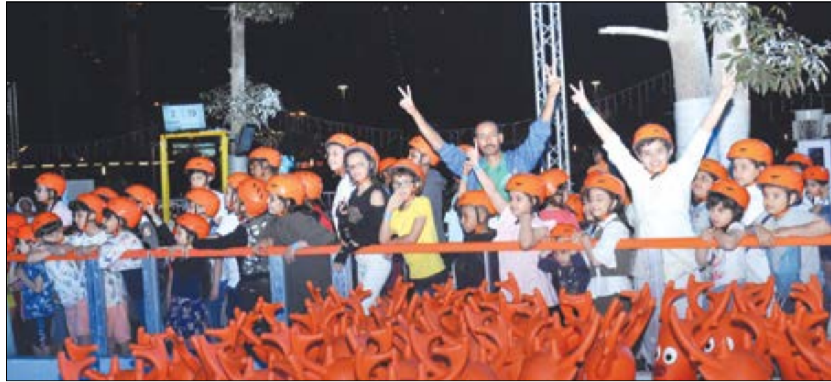
فرحة كبيرة بأنشطة المهرجان