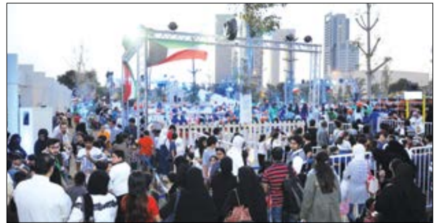
إقبال كبير من الزوار على الاستمتاع بفعاليات قرية الثلوج مع اقتراب المهرجان من اختتامه