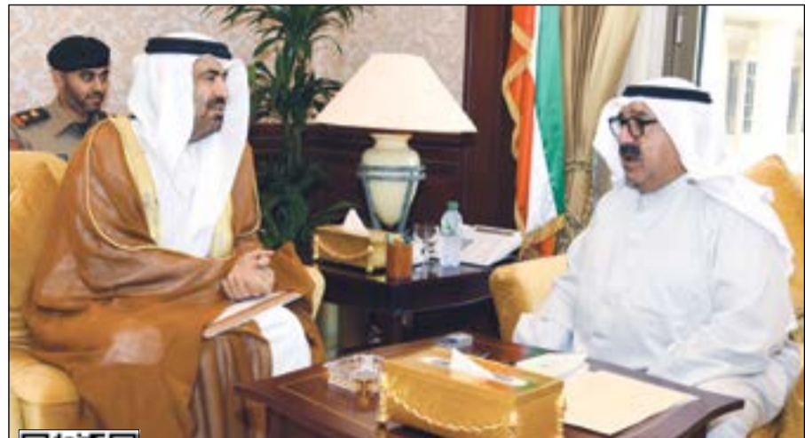
الشيخ ناصر صباح الأحمد خلال استقباله سفير الإمارات رحمة الزعابي