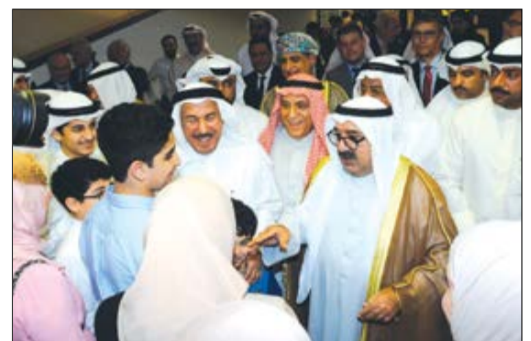
الشيخ ناصر صباح الأحمد متحدثا إلى بعض الحضور في المعرض