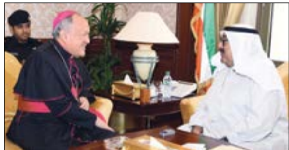
الشيخ ناصر صباح الأحمد خلال استقباله سفير الفاتيكان

وقالت مديرة التوجيه المعنوي والعلاقات العامة بوزارة الدفاع في بيان صحافي ان السفير الزعابي قدم للشيخ ناصر الصباح خلال اللقاء دعوة رسمية من ولي عهد أبوظبي نائب القائد الأعلى للقوات المسلحة سمو الشيخ محمد بن زايد آل نهيان لزيارة دولة الإمارات، مبدية أن «الشيخ ناصر الصباح تفضل بقبولها شاكرًا لسمو الشيخ محمد بن زايد آل نهيان هذه الدعوة الكريمة». كما التقى الشيخ ناصر الصباح مع عدد من سفراء الدول الشقيقة والصديقة كل على حدة سفير سلطنة عمان الشقيقة لدى البلاد عدنان الأنصاري وسفير مملكة بلجيكا الصديقة بيت هيربوت وسفير الكرسي الرسولي (الفاتيكان) الصديقة لدى البلاد البابوي المطران فرانسيسكو