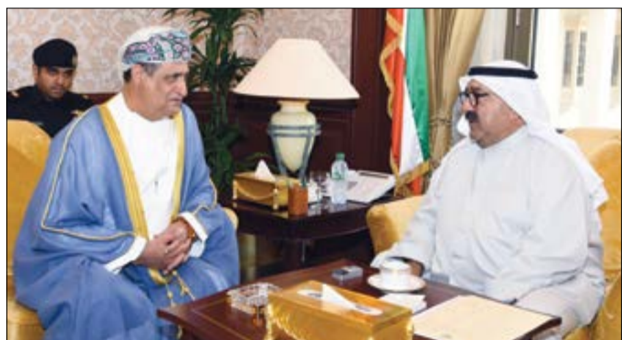
الشيخ ناصر صباح الأحمد مستقبلا سفير سلطنة عمان عدنان الأنصاري

الأمر ذات الاهتمام المشترك وسبل تعزيزها وتطويرها، فضلا عن بحث التطورات والمستجدات على الساحتين الإقليمية والدولية.