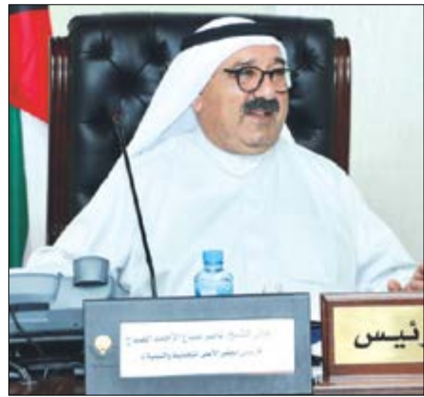
الشيخ ناصر صباح الأحمد مترئسا الاجتماع السابع للمجلس الأعلى للتخطيط والتنمية

من فريق يمثل وزارة الصحة تناول استراتيجية القطاع الصحي محليا وسياسات تطوير العنصر البشري ومؤشرات الأداء لتطوير الصحة العامة. وذكرت ان المجلس اختتم اعمال اجتماعه بالاطلاع ومناقشة مذكرة لجنة التنمية البشرية والعمرانية حول مشروع المخطط الهيكلي الرابع للدولة ومدى اتساقه ورؤية «الكويت 2035»، وضرورة قيام بلدية الكويت بالتنسيق مع الجهات المعنية بمشروع مدينة الحرير والجزر ليشمل المخطط الهيكلي للمشروع ككل. رقم 183 لسنة 2017 بإحالة مشروع قانون للحكومة يعقد قروض عامة وعمليات تمويل من الاسواق المحلية والعالمية تناولت اجراءات وضوابط ادارة القروض وطريقة واسلوب انفاقها. وأضافت الصبيح ان الاجتماع ناقش أيضا رؤية مركز الكويت للسياسات العامة المقترحة حول نظام التأمين الصحي واثره على ميزانية القطاع الصحي بالدولة. وأوضحت انه تم الاستماع الى مقترحات حول خطة اصلاح النظام الصحي (العلاج بالخارج والحلول القصيرة والطويلة) مقدمة