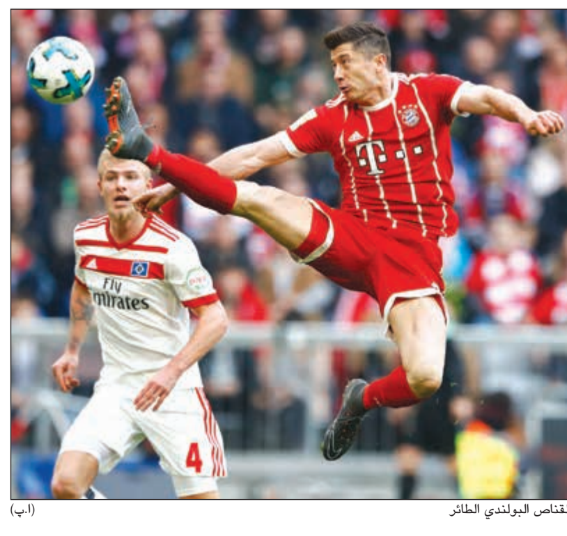
الغناص البولندي الطائر