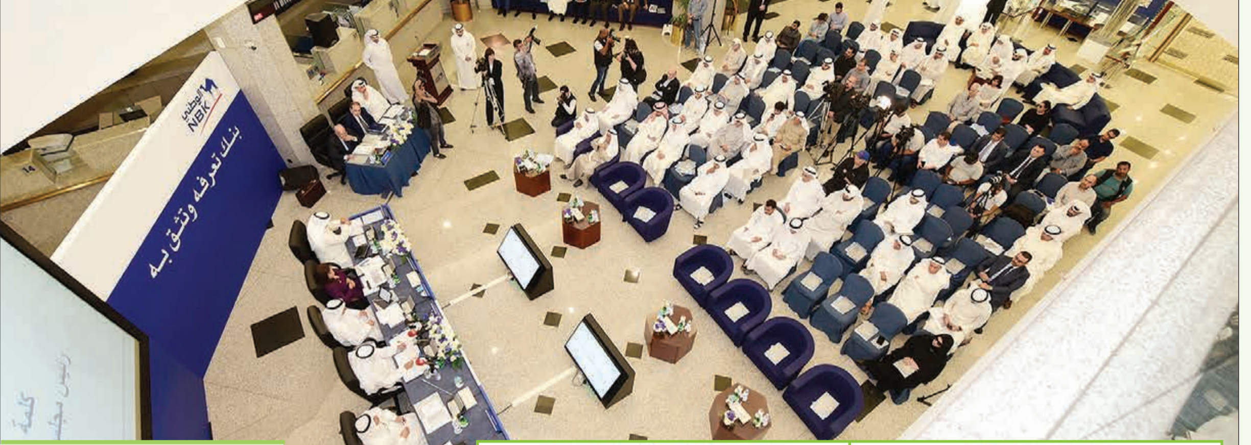
التوزيعات النقدية وأسهم المنحة لمساهمي البنك الوطني