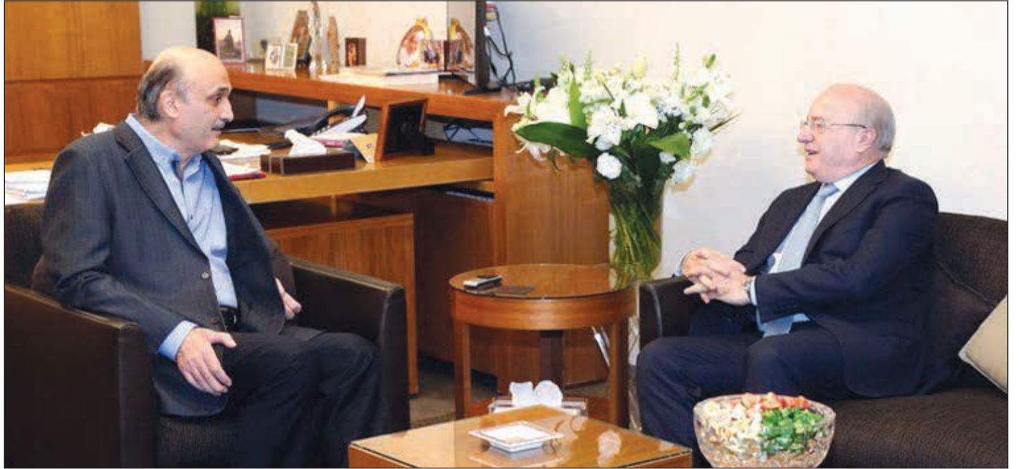
رئيس حزب القوات اللبنانية سمير جعجع مستقبلاً في معراب وزير الثقافة غطاس خوري موفداً من رئيس الحكومة سعد الحريري أمس