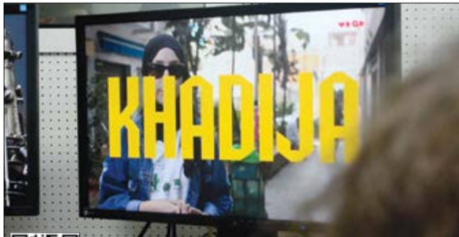
مشاهدات مليونية لـ «مروكيات»