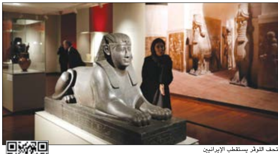
متحف اللوفر يستقطب الإيرانيين