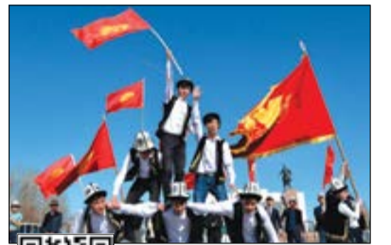
عدد من القيرغيزيين يرتدون قبعة الكالبك