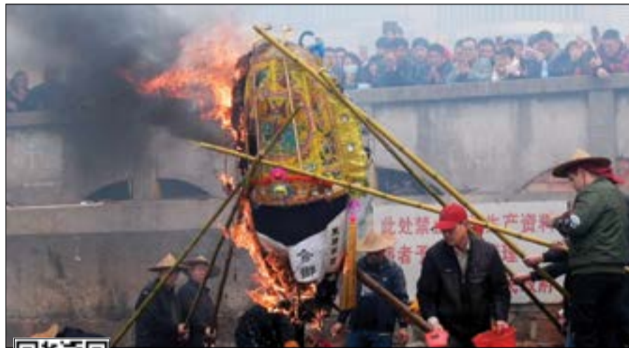
صيادون صينيون يأملون في موسم وافر في ظل شح الأسماك