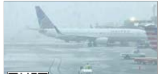
العاصفة الثلجية تسببت في إلغاء عشرات الرحلات