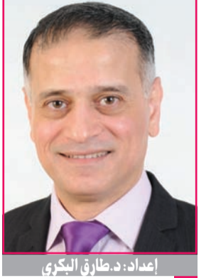
إعداد: د. طارق البكري