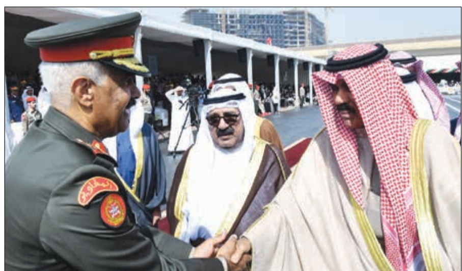
سمو ولي العهد الشيخ نواف الأحمد مصافحا رئيس الأركان الفريق الركن محمد الخضر