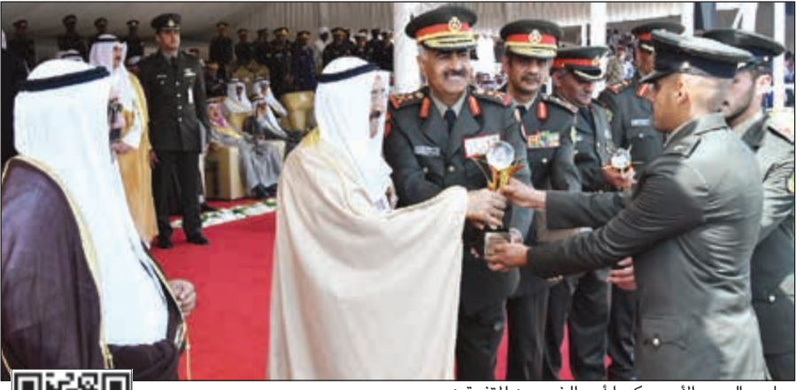
صاحب السمو الأمير مكرم أحد الخريجين المتفوقين