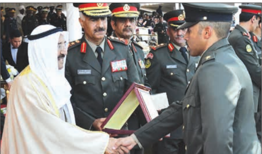
سمو الأمير مصافحا أحد الخريجين المكرمين