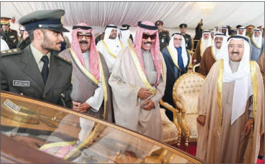
هدية تذكارية لسمو ولي العهد الشيخ نواف الأحمد