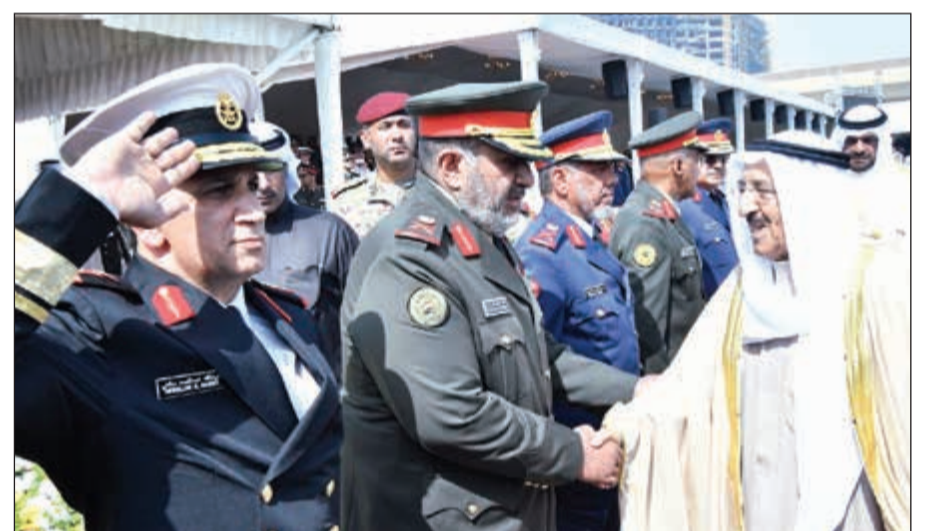
صاحب السمو الأمير الشيخ صباح الأحمد مصافحا عددا من العسكريين (قاسم باشا)

الصف والأفراد المعلمين والمدرين والإخوة المحاضرين الأستاذة من جامعة الكويت والهيئة العامة للتعليم التطبيقي والتدريب ووزارة الداخلية بكافة قطاعاتها ووزارة الأوقاف والشؤون الإسلامية ووزارة الدولة لشؤون الشباب والهيئة العامة للشباب والرياضة وقيادة الحرس الوطني وكذلك هيئة الاستخبارات والأمن والقوة البرية وهيئة التعليم العسكري وشركة زين للاتصالات وأخيرا لواء صالح الحمد الألي/94 على ما بذلوه في إعداد هذه النخبة المتميزة من الخريجين. سيدي حفظكم الله ورعاكم، لقد استضافت الكلية طلبة ضباطا من كل من: