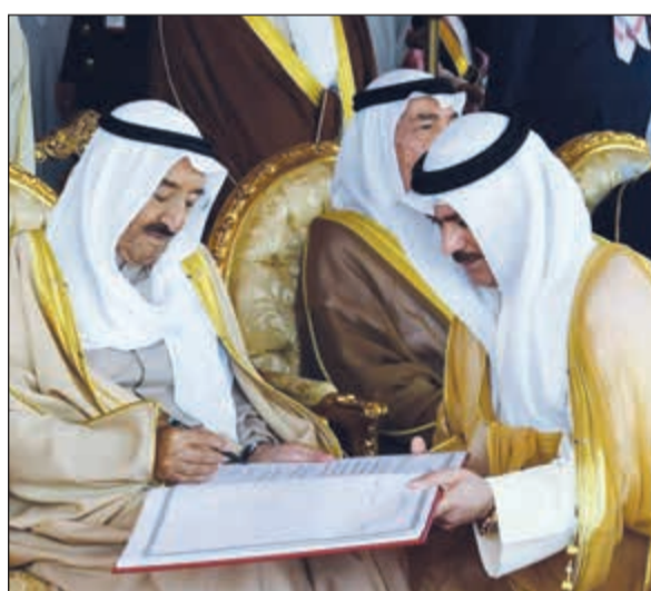
صاحب السمو الأمير يسجل كلمة بسجل كلية علي الصباح العسكرية