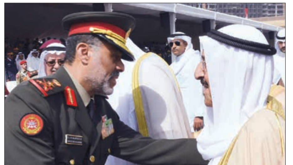
صاحب السمو مصافحا نائب رئيس الأركان الشيخ عبدالله النواف