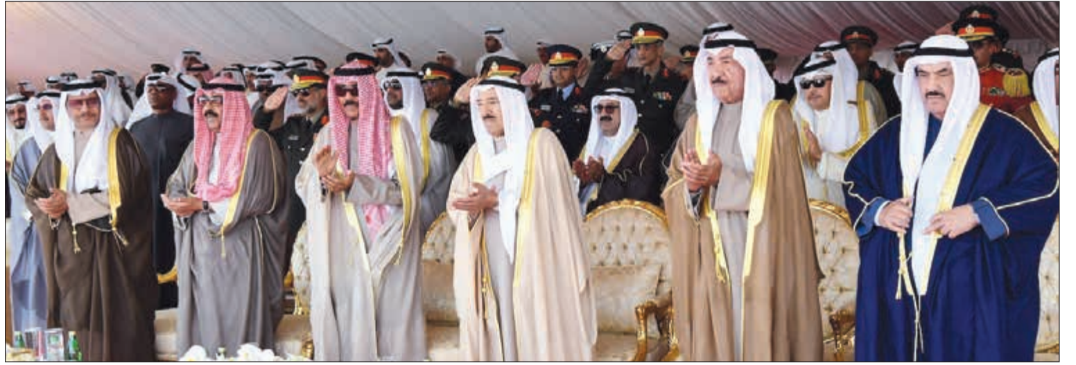
صاحب السمو الأمير الشيخ صباح الأحمد وسمو ولي العهد الشيخ نواف الأحمد والشيخ جابر العبدالله والشيخ مشعل الأحمد وسمو الشيخ ناصر الحمد وسمو الشيخ جابر المبارك والشيخ ناصر صباح الأحمد