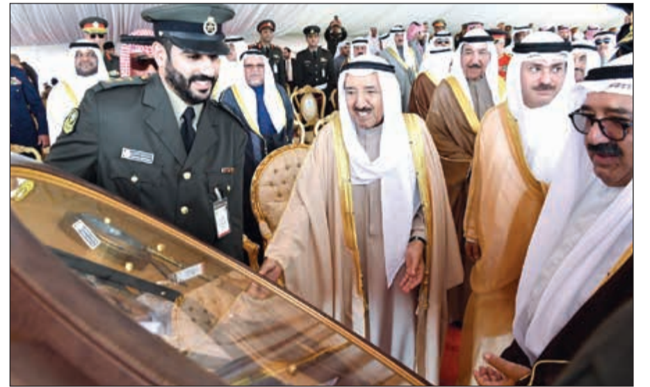
هدية تذكارية لصاحب السمو الأمير