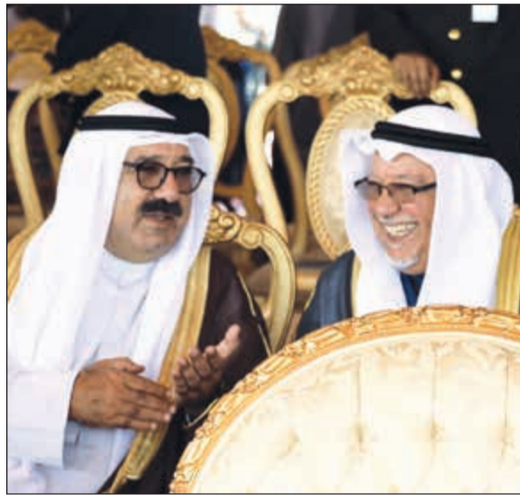
الشيخ ناصر صباح الأحمد والشيخ علي الجراح خلال الحفل