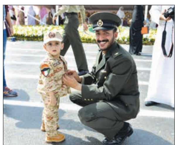
شبل من أسد

مساعد أمر كلية علي الصباح العسكرية العميد الركن خالد شجاع العتيبي. وتفضل صاحب السمو الأمير الشيخ صباح الأحمد بتوزيع الجوائز على الطلبة الأوائل والمتفوقين من كلية علي الصباح العسكرية. بعدها قام أمير قيادة شؤون الطلبة الضباط العقيد الركن عادل عبدالله الكندري بتلاوة اليمين القانونية للخريج ومن ثم الاستئذان بانتهاء طابور العرض العسكري وعزف السلام الوطني إيداناً بانتهاء الحفل.