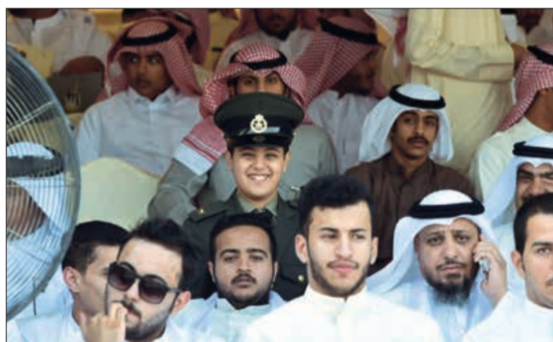
عسكري صغير يشارك الخريجين فرحتهم

عبدالهادي العجمي تحت رعاية وحضور صاحب السمو الأمير الشيخ صباح الأحمد القائد الأعلى للقوات المسلحة أقيم صباح أمس حفل تخرج الطلبة الضباط الجامعيين من الدفعة (21) والطلبة الضباط من الدفعة (45) بكلية علي الصباح العسكرية. ووصل موكب سموه إلى مكان الحفل حيث استقبل بكل حفاوة وترحيب من النائب الأول لرئيس مجلس الوزراء ووزير الدفاع الشيخ ناصر صباح الأحمد ورئيس الأركان العامة للجيش الفريق الركن محمد الخضر ووزير الدفاع الشيخ أحمد المنصور وأمر كلية علي الصباح العسكرية اللواء الركن بدر العوضي