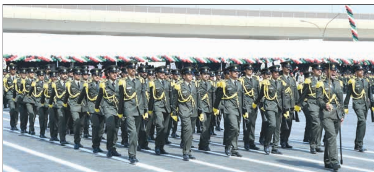
جانب من العرض العسكري خلال الحفل