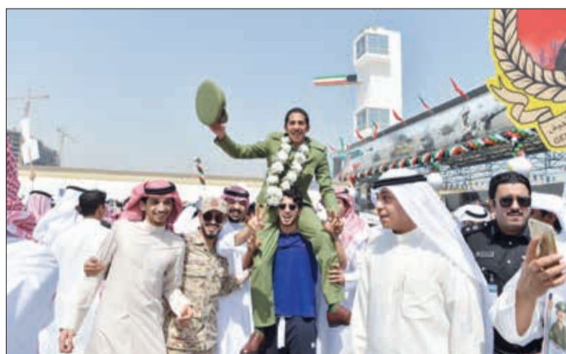
خريج فوق الأعتاق