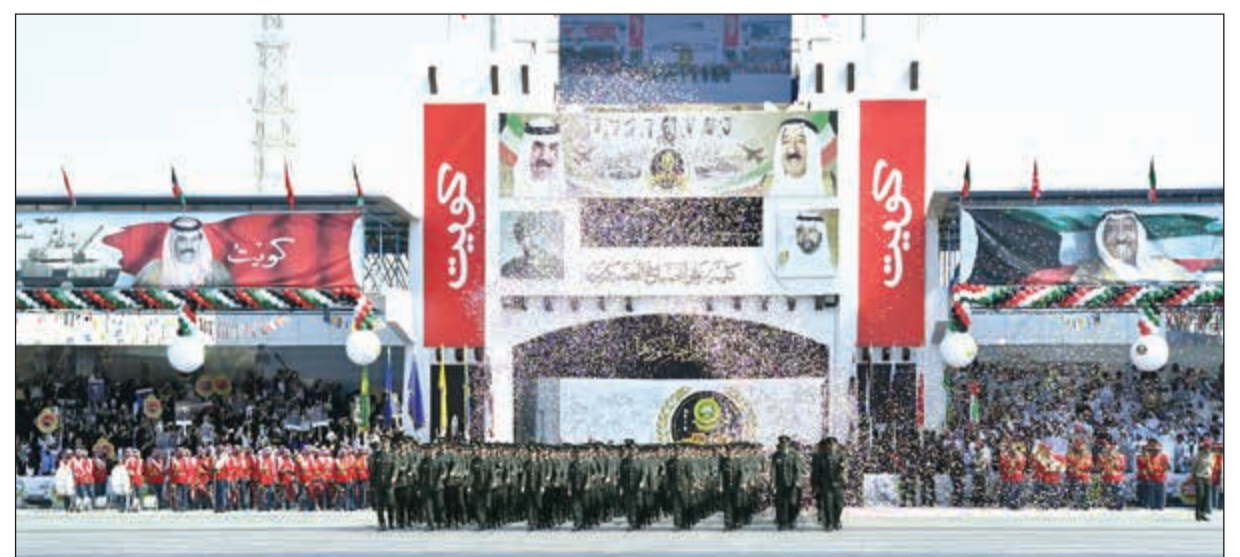
احتفاء بالخريجين خلال الحفل وعزف الموسيقى العسكرية