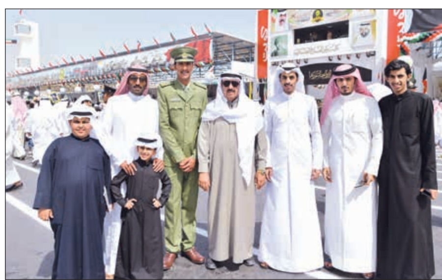
خريج مع أسرته