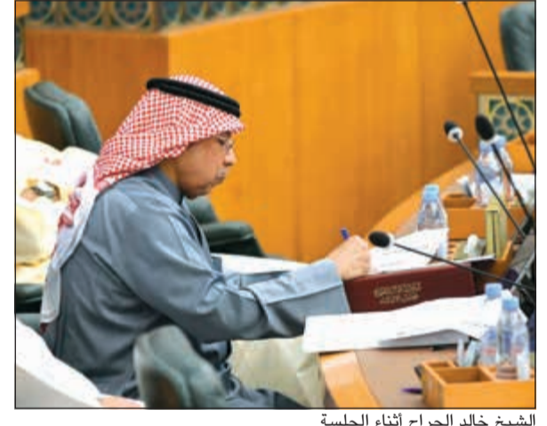
الشيخ خالد الجراح أثناء الجلسة