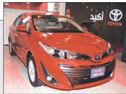
تويوتا «ياريس» الجديدة كلياً (عادل سلامة)