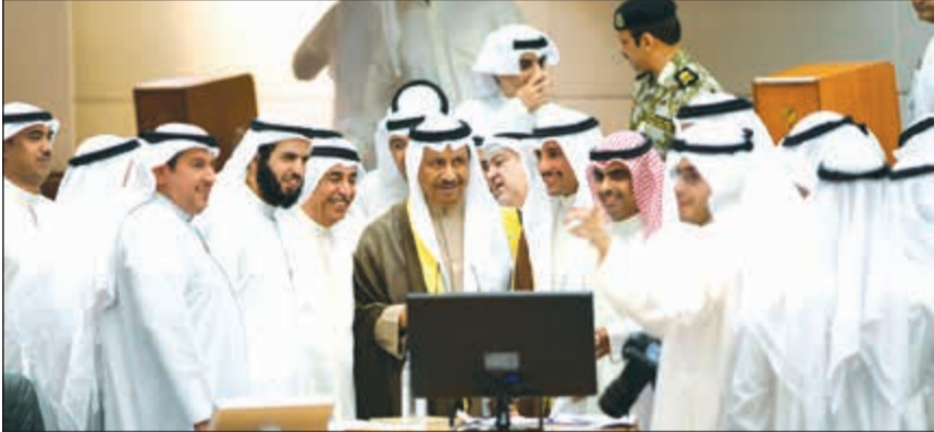
مرزوق الغانم وسمو الشيخ جابر المبارك مع النائبين المستجوبين والوزير الخرافي وجمع من النواب بعد انتهاء المساءلة في ختام جلسة الاستجواب في مجلس الأمة أمس

قال رئيس مجلس إدارة غرفة التجارة والصناعة علي الغانم إن استضافة الكويت ملتقى الاستثمار 2018 تسهم في التأكيد على الفرص الحقيقية والعائدات المضمونة من الاستثمار في الكويت. وأضاف الغانم، أن الغرفة عازمة ومن خلال هذا الملتقى الذي سيعقد في 20 و21 الجاري، على إبراز قوة الاقتصاد الكويتي الحقيقية ومدى التجانس والتعاون الحكومي مع القطاع الخاص الذي نتجت عنه بيئة استثمارية جذابة وتحمل آفاقاً مستقبلية واعده للمستثمرين. وقال الغانم إن الكويت تمنح حماية للمستثمر الأجنبي ولا تميزه عن المواطن الكويتي. • التفاصيل ص27