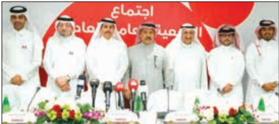
الشيخ سعود بن ناصر آل ثاني والشيخ محمد بن عبدالله آل ثاني في لحظة جماعية مع قيادات Ooredoo (محمد هاشم) عقب الجمعية العمومية