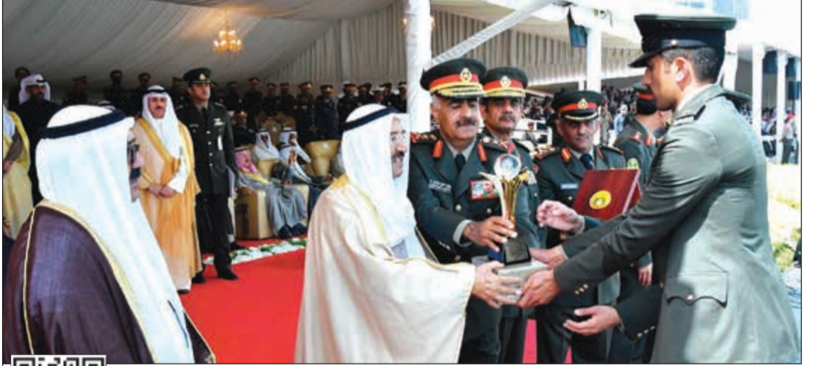
صاحب السمو الأمير الشيخ صباح الأحمد مكرماً أحد الخريجين المتفوقين بحضور الشيخ ناصر صباح الأحمد والفريق محمد الخضسر (قاسم باشا)