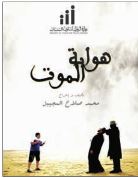
..وفيلم «هواية الموت»