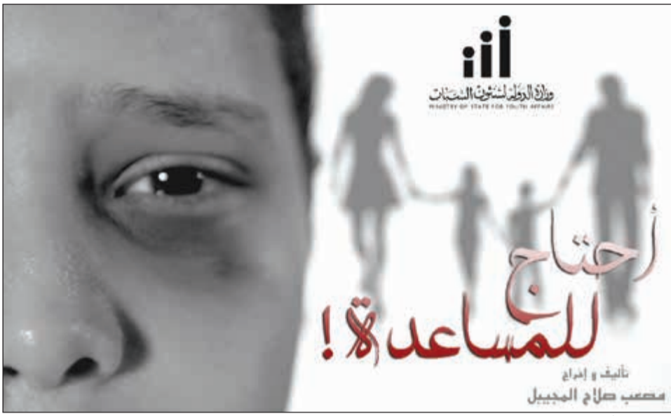
..وبوستر «أحتاج للمساعدة»