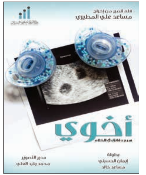
بوستر فيلم «أخوي»

ينطلق غداً ويستمر حتى 10 الجاري في «حديقة الشهيد»