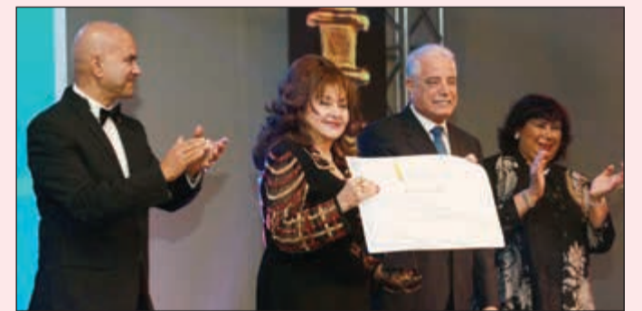
لحظة تكريم الفنانة القديرة ليلي طاهر