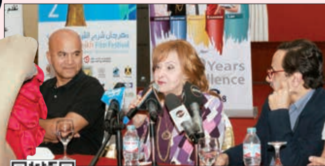
..وترد على أسئلة جمهورها في ندوتها على هامش المهرجان