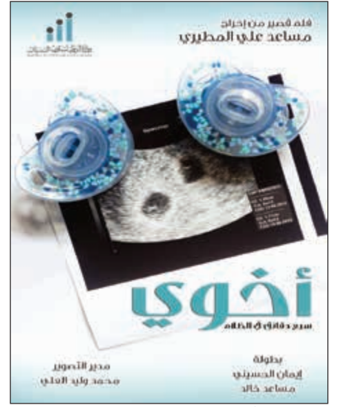
بوستر فيلم «أخوي»

ينطلق غداً ويستمر حتى 10 الجاري في «حديقة الشهيد»