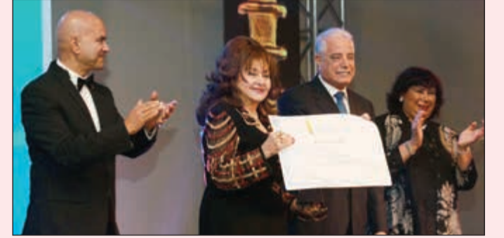
لحظة تكريم الفنانة القديرة ليلي طاهر