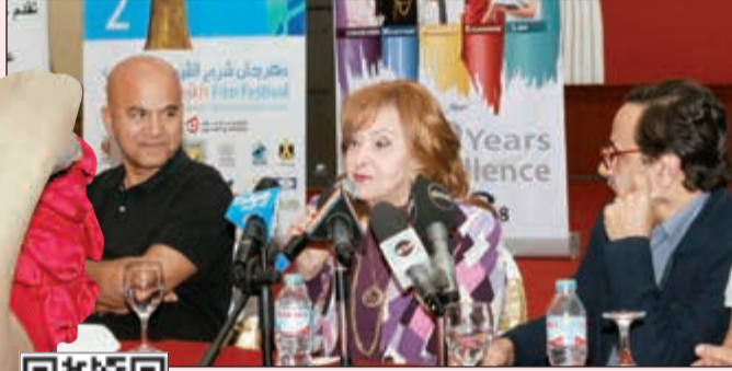
..وترد على أسئلة جمهورها في ندوتها على هامش المهرجان