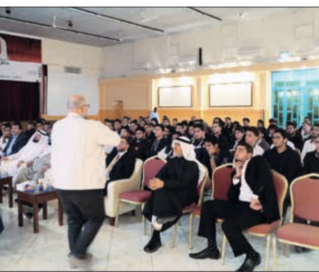
شرح حول طرق القيادة الآمنة والالتزام بقواعد السلامة