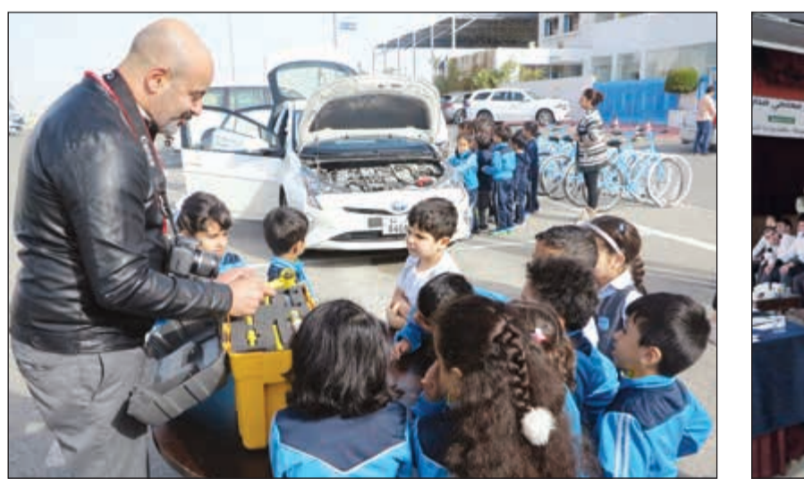
توضيح لآلية عمل محرك السيارة