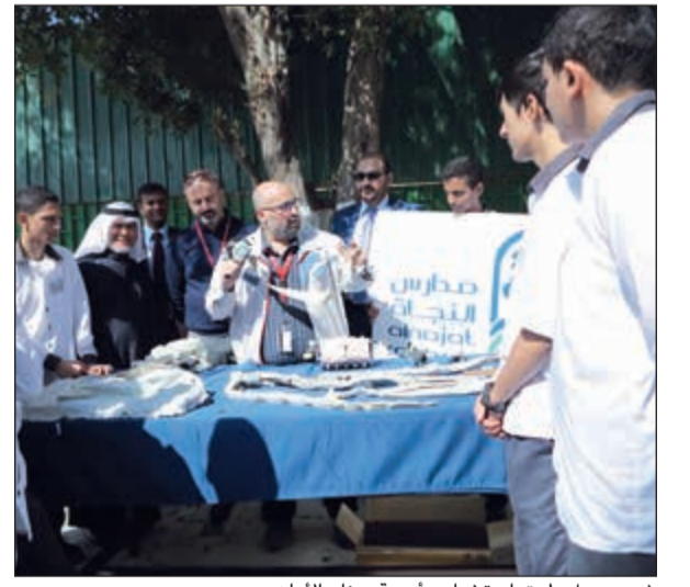
شرح حول طرق استخدام وأهمية حزام الأمان