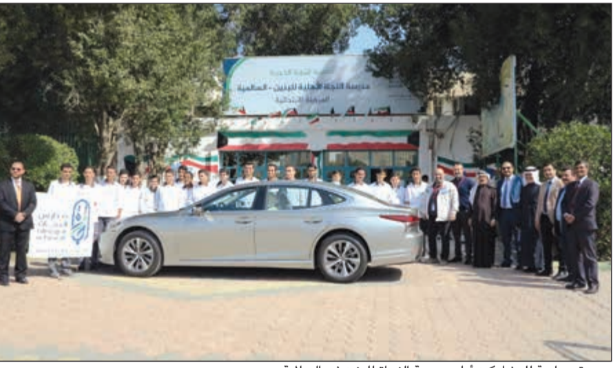
صورة جماعية للمشاركين أمام مدرسة النجاة للبنين في السالمية

التقليل من الوفيات الناتجة عن حوادث المرور، ونعمل باستمرار مع شركائنا للمساهمة في بناء مجتمع يقدر ويؤمن القيادة الآمنة. كما تعرف الأطفال في أكاديمية ريبون على سيارة تويوتا بريوس هايبريد، أول سيارة هايبريد في العالم تعمل بالوقود وبطارية تعمل بمحرك كهربائي بأقل انبعاثات من غاز ثاني أكسيد الكربون، وقد نظم فريق التدريب الفني في «الساير» عرضاً لتسليط الضوء على مزايا بريوس الهجينة، وتضمن العرض تجربة للمس والتمتع والتعرف مباشرة على التجهيزات والأدوات المصممة خصيصاً للسيارات الهجينة.