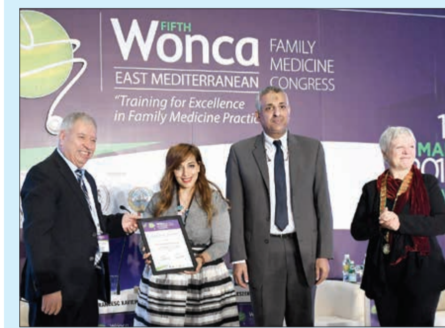
جانب من تكريم شركة «زين» خلال المؤتمر

السلام الدولي ومركز سمان للسكري وغيرها، حيث لن تدخر الشركة جهداً للمساهمة في خدمة المجتمع وأفراده من خلال تنظيم ودعم المبادرات الطبية المختلفة. وأوضحت «زين» أن رعايتها لهذا المؤتمر وغيره من المبادرات الماثلة ما هو إلا ترجمة فعلية لاستراتيجيتها في مجال المسؤولية الاجتماعية والاستدامة في المجالات الصحية، حيث تقوم الشركة وبشكل دوري بتكثيف حملاتها لنشر الثقافة الصحية في المجتمع بأحدث الوسائل والطرق للوقاية من الأمراض وتغاديرها، بالإضافة إلى عقد الشراكات الاستراتيجية مع المؤسسات الطبية العامة والخاصة في الكويت بهدف المساهمة في رفع الوعي الصحي في المجتمع. الجدير بالذكر أن المنظمة العالمية لأطباء الأسرة «ونكا» هي منظمة غير ربحية تأسست في عام 1972 من قبل المنظمات الأعضاء في 18 بلداً، ولديها الآن 118 عضواً في 131 بلداً وإقليمياً مع عضوية حوالي 500,000 طبيب متخصص بطب الأسرة، كما تغطي المنظمة أكثر من 90% من سكان العالم.