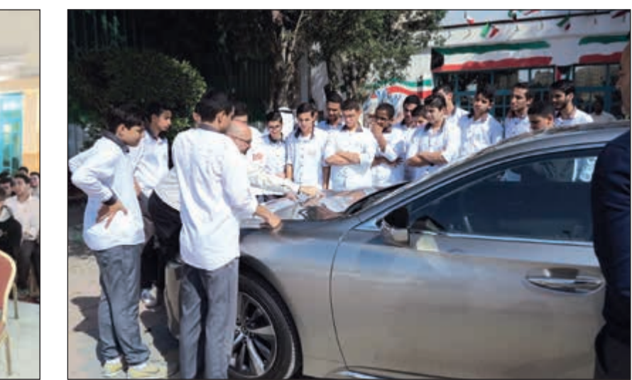
شرح مباشر على إحدى السيارات