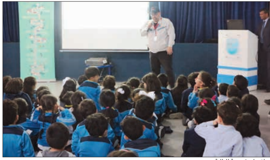
محاضرات توعوية للطلبة