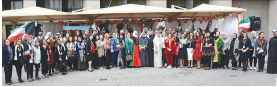
جانب من احتفال موظفي البنك الأهلي الكويتي بالعيد الوطني ويوم التحرير

يعمل فيها الفرع، والمسابقة الثانية عبارة عن مسابقة فنية لأبناء الموظفين بالبنك الأهلي الكويتي، وتشترط أن تعكس هذه الرسومات احتفالات العيد الوطني مع الإشارة إلى البنك الأهلي سواء في شكل المبنى الرئيسي أو أي فرع من فروع البنك أو شعار البنك. وسيواصل البنك الأهلي الكويتي مشاركته الفرحة بالأعياد الوطنية مع موظفيه كل عام حرصاً منه على تعزيز الروح الوطنية وترسيخ حب الكويت بين موظفيه.