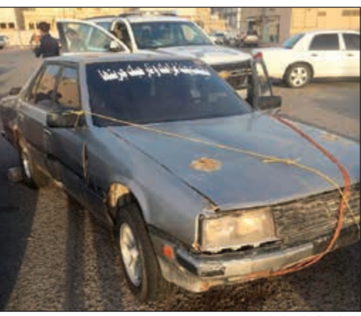
المتكففة، إلى كراج الحجز

شرع رجال مباحث صباح السالم في البحث عن شخص يرجح انه مواطن للتأكد من حقيقة حيازته لسلاح ناري، وكذلك لإقدامه على تصليح ذراع جام دون دفع قيمة الإصلاح لصاحب كراج. وبحسب مصدر امني فإن عمليات