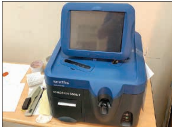
جهاز الـ «IONSCAN500DT»