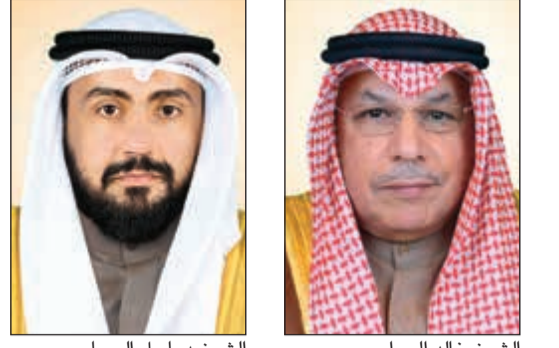
الشيخ خالد الجراح