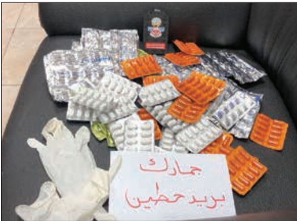
الحبوب التي تم ضبطها في الطرد