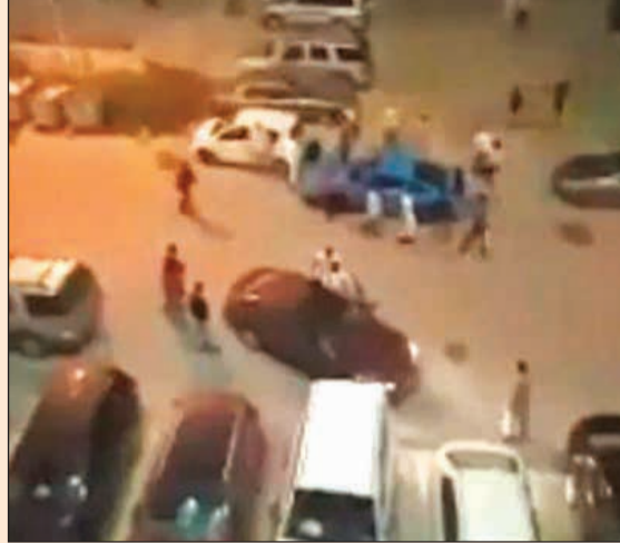
مركبة المواطن وهي تتعرض للإتلاف

استطاع رجال مباحث أبو حليفة ضبط 11 شخصاً من غير محددى الجنسية وسوريين لاتهامهم بضرب مواطن وصديقه الأردني وتهشيم سيارته الأميركية بالعجلات والأدوات الحادة على خلفية مشاجرة وقعت بينهم، وكانت «الأنباء» قد أشارت الى تفاصيل القضية مطلع الأسبوع الجاري. وبحسب مصدر امني فإن رجال مباحث أبو حليفة وعقب التحريات تمكنوا من ضبط «بدون» وسوري وهم من بين المشاركين في عملية البلطجة والتجمهر. ومن خلال الموقوفين تم تحديد بقية المتهمين ومن المقرر أن توجه إليهم تهم إتلاف مال الغير والاعتداء بالضرب. يشار إلى أن وسائل التواصل الاجتماعي كانت قد تداولت مقطعاً لواقعة الاعتداء، فيما تقدم مواطن ووافد اردني الى مخفر أبو حليفة وأبلغا عن تعرضهما للضرب، وقال المواطن إن سيارته تعرضت للتلف الشديد من قبل أشخاص مجهولين تشاجر معهم.