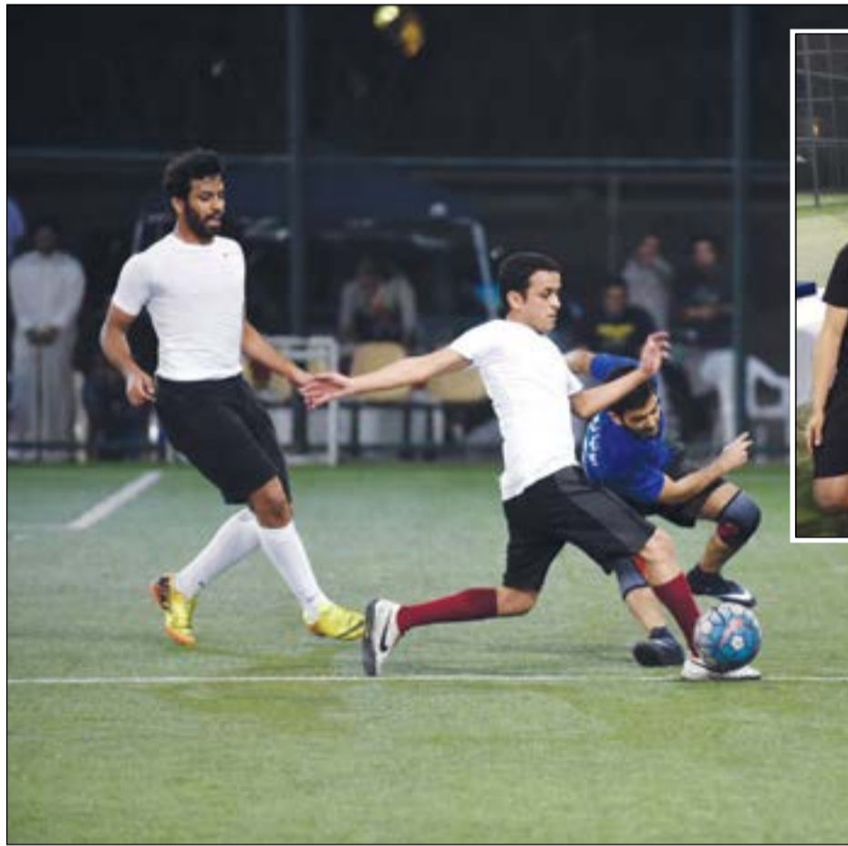
صراع وندية على الكرة