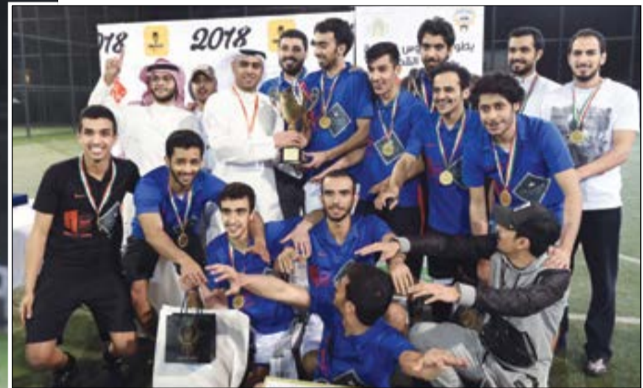
تتويج فريق تركي الدبوس بلقب البطولة