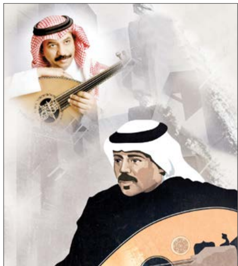
أعمال الراحل أبوبكر سالم يحييها عبادي الجوهري