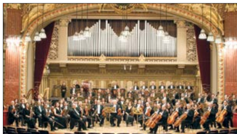
أوركسترا بوخارست فلهارمونيكا