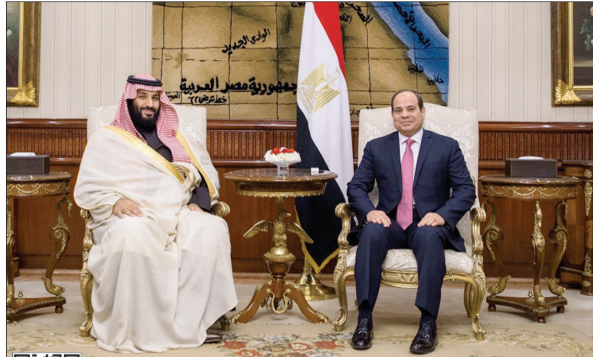
الرئيس السيسي مستقبلاً صاحب السمو الملكي الأمير محمد بن سلمان ولي العهد نائب رئيس مجلس الوزراء وزير الدفاع السعودي بالقاهرة أمس (أ. ب.)

وأوضح السفير بسام راضي أنه تم خلال اللقاء التباحث حول سبل تعزيز مختلف جوانب العلاقات الثنائية بين البلدين، لاسيما الاقتصادية والاستثمارية منها، وتدشين المزيد من المشروعات المشتركة في ضوء ما يتوافق في البلدين من فرص استثمارية واعدة، وخاصة في مجال الاستثمار السياحي بمنطقة البحر الأحمر لتعظيم الاستفادة من الإمكانيات والمقومات السياحية الكبيرة لتلك المنطقة.