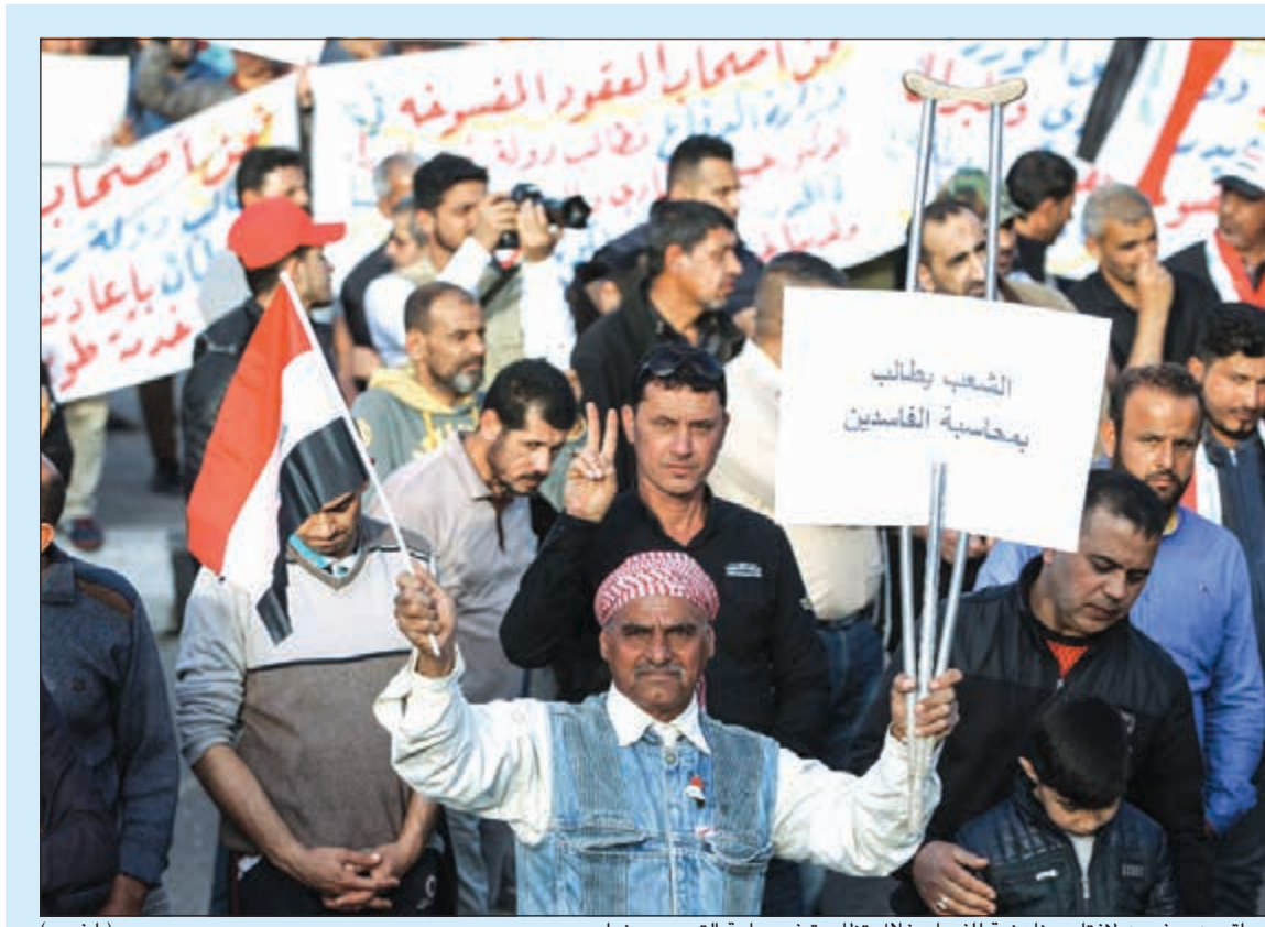
عراقيون يرفعون لافتات مناهضة للفساد خلال تظاهرة في ساحة التحرير ببغداد

اللقاء «وسناقش العدوان الإيراني في المنطقة عامة، وخاصة المخطط النووي كما سنناقش مع الرئيس دفع السلام قداما». وتأتي زيارة نتنياهو إلى الولايات المتحدة فيما العلاقات الثنائية في نزولها، حيث سيلتقي الرئيس ترامب الذي يصفه بأنه «صديق حقيقي»، فيما يطبق الرئيس الأميركي سياسة دعم ثابت لإسرائيل وحكومتها. في غضون ذلك، أطلقت الشرطة الإسرائيلية النار على سائق سيارة فلسطيني قرب محطة القطارات بمدينة عكا بدعوى محاولته تنفيذ