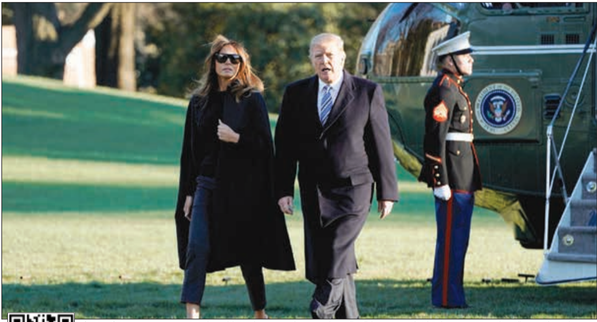
الرئيس الأميركي دونالد ترامب وزوجته ميلانيا خلال عودتهما إلى البيت الأبيض قادمين من فلوريدا امس الأول