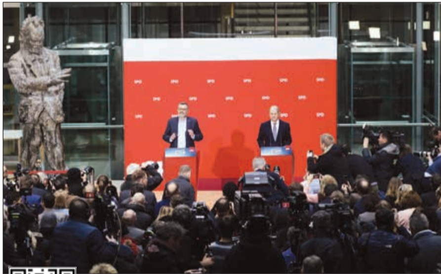
قادة الحزب الاشتراكي الديموقراطي خلال الاعلان عن دعم التحالف مع حزب ميركل امس