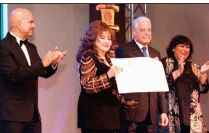
تكريم الفنانة القديرة ليلي طاهر

المقرر عرضه في رمضان المقبل، فضلا عن انشغال ياسمين صبري بفيلم «ليلة هنا وسرور» مع النجم محمد عادل إمام. «قلب أمه» بطولة هشام ماجد وشيخو، ونور قدرى وبيومي فؤاد، وأوس أوس، وجار التعاقد مع شخصيات أخرى، إخراج عمرو صلاح، وفيلم «ولاد أبو إسماعيل» بطولة سعد الصغير ومحمد لطفي وبيومي فؤاد ويوسي ومحمود الليثي، وآخرين، إخراج تامر بسيوني.