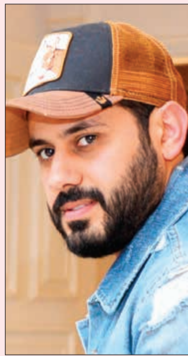
النجم عبدالله بوشهري

مملكة البحرين على صعيد كل العمليات الفنية والإنتاجية، كما سيصور العمل بين مملكة البحرين وجمهورية السودان