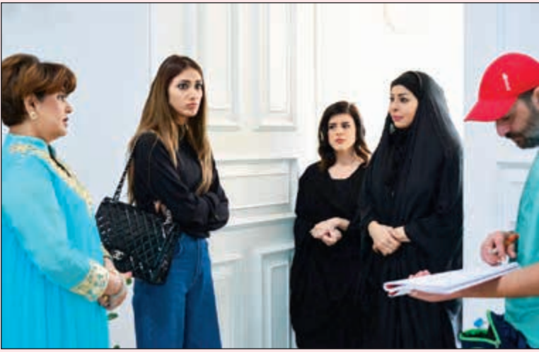
مشهد من مسلسل «الخطايا العشر»