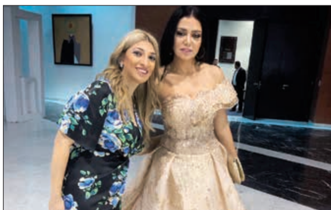
«الأنباء» مع الفنانة رانيا يوسف في حفل الافتتاح