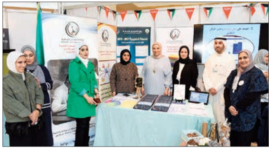
عدد من المشاركين في الاحتفال

وزارة الداخلية سيتم توقيعه بعد الحصول على موافقة الجهات الرقابية على الاتفاقية الاستشارية لهذا المشروع.