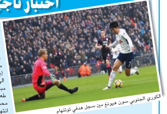
الكوري الجنوبي سون هيونغ مين سجل هدفي توتنهام

خاض توتنهام اختباراً ناجحاً قبل مواجهة المرتقبة مع يوفنتوس الإيطالي في دوري أبطال أوروبا بفوزه على ضيفه هارسفيلد 2-0. ورفع توتنهام رصيده إلى 58 في المركز الثالث مؤقتاً. وبدخل الفريق اللندني الشمالي مباراته ضد يوفنتوس مرشحاً بلوغ ربع النهائي بعد انتزاعه التعادل 2-2 في تورينو قبل ثلاثة أسابيع. سجل هدفي توتنهام الكوري الجنوبي سون هيونغ مين. في المقابل، عزز بيرنلي مفاجأة الموسم، حظوظه بالمشاركة في الدوري الأوروبي (يوروبالغ) بفوزه على أحد منافسيه المباشرين ايفرتون 2-1. ورفع بيرنلي رصيده إلى 40 نقطة في المركز السابع متقدماً على ليستر سيتي بفارق 4 نقاط (يملك الأخير مباراة مؤجلة) و6 نقاط على ايفرتون التاسع. وانتهى بيرنلي 11 مباراة لم يذق فيها طعم الانتصار. وسحق سوانزي سيتي وست هام 4-1. وانتزع الجزائري رياض محرز نقطة في الرمق الأخير للبتيسر سيتي في مواجهة ضيفه بورنموث التي انتهت بتعادلهما 1-1. وسقط وست بروميتش البيون أمام وانفورد 0-1. وتعادل ساوثمبتون مع ستوك سيتي سلباً.