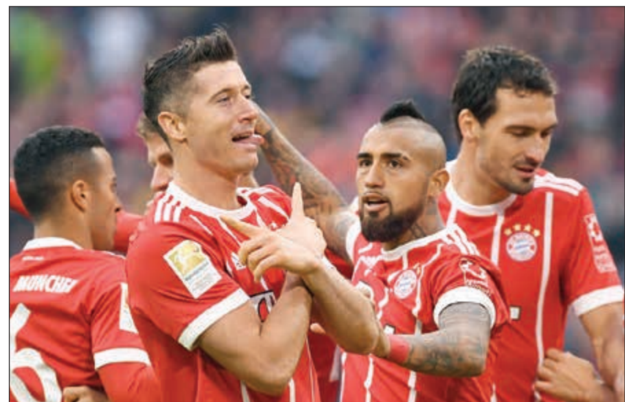
بايرن ميونخ للاقتراب خطوة من لقب الدوري

وفاز هوفنهايم على مضيفه اوغسبورغ بهدفين نظيفين وانقل إلى المركز السابع برصيد 35 نقطة، وبات قريباً من الفرق التي تتنافس على