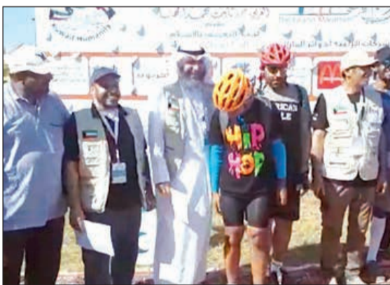
جانب من تكريم الفائزين بالماراثون