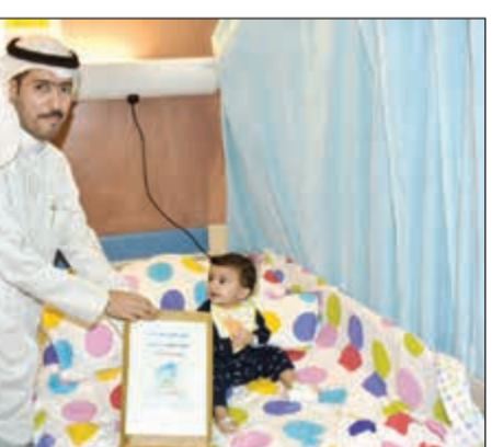
هدية لأحد الأطفال